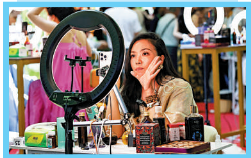
▲主播在第六屆消博會的一家化妝品展區直播。新華社