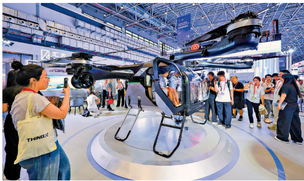
▲4月13日，第六屆中國國際消費品博覽會在海南海口舉行。圖為展出的「陸地航母」一體式飛行汽車吸引參觀者。