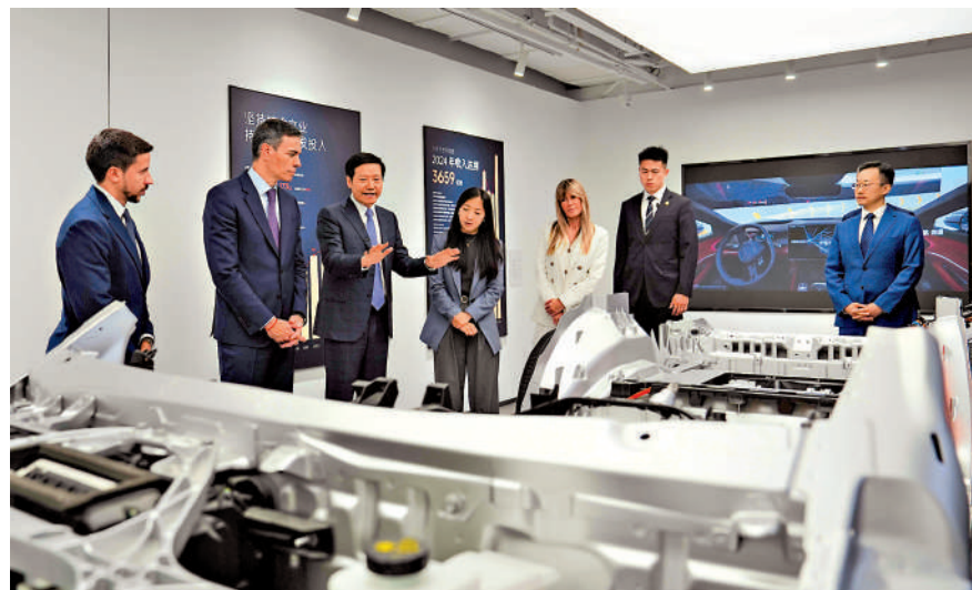
4月13日，西班牙首相桑切斯在北京的小米科技園參觀。

另有外媒報道，桑切斯在演講中明確表示，世界離不開中國。他說，歐洲是維護世界穩定、繁榮與和平的關鍵力量，若沒有一個團結的歐洲，而是支離破碎的，穩定的國際秩序便無從談起，人類的繁榮未來更無法實現。同樣如果沒有中國這個偉大國家的參與，這一切