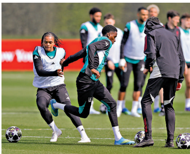
安古莫夏（左）積極備戰。