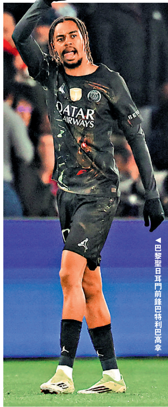
巴黎聖日耳門前鋒巴特利巴高拿。