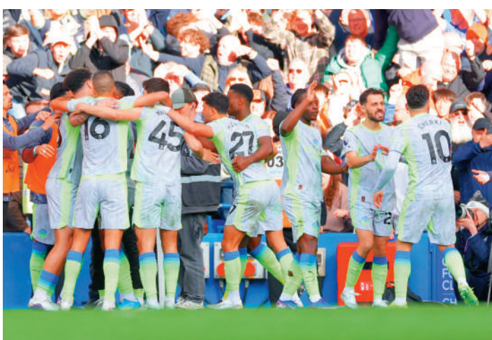
曼城球員慶祝取得入球。