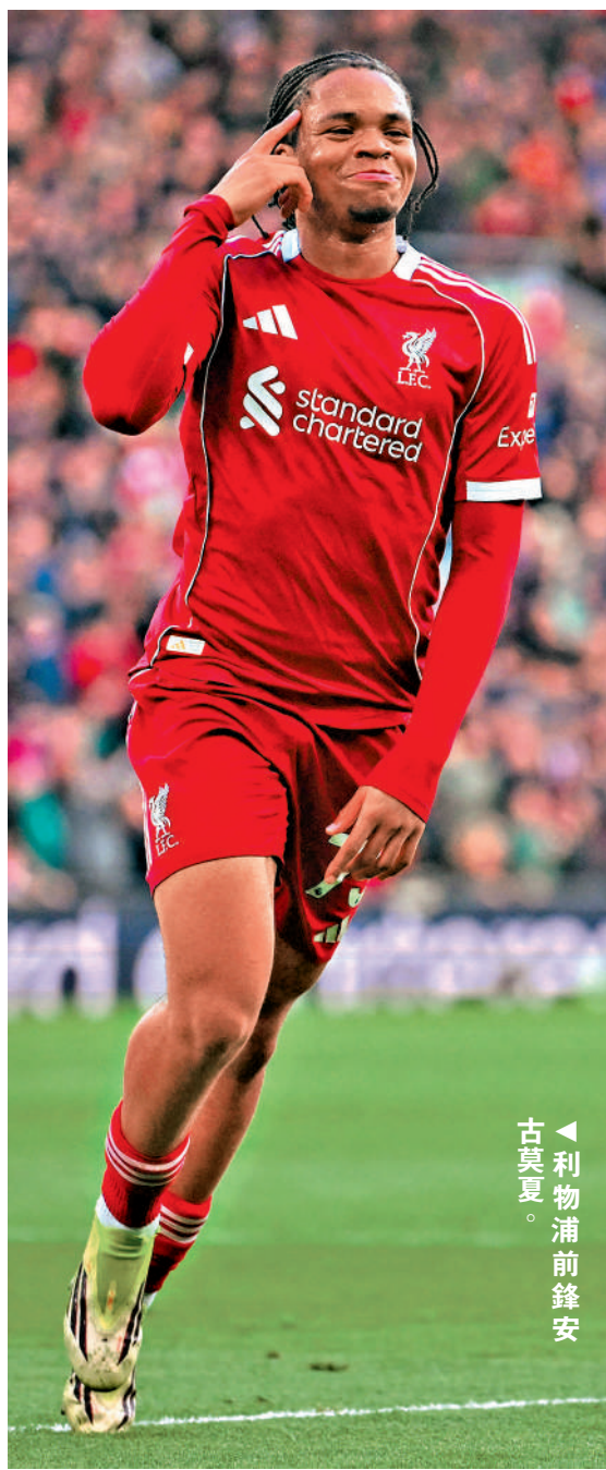
利物浦前鋒安古莫夏。

賽事形勢方面，利物浦剛結束三連敗，狀態及時回升，預計球隊有望取得入球，燃起晉級希望。然而面對聖日耳門的強勁鋒線，要保持不失球亦相當困難。讓球盤口利物浦要讓平手/半球，明顯過火，宜取下盤更有勝算。