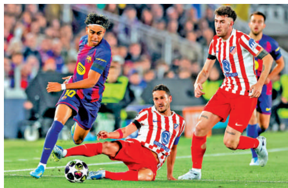
巴塞隆拿前鋒耶馬爾（左）。