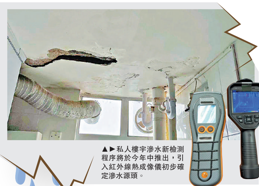
私人樓宇滲水新檢測程序將於今年中推出，引入紅外線熱成像儀初步確定滲水源頭。

立法會議員楊永杰表示，政府推出新檢測程序先導計劃，值得全力支持。他期望政府為住戶提供專業檢測及修葺人士、承建商名單連同參考價格。