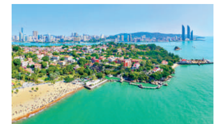
▲廈門向首次赴大陸的台胞推出多種優惠，包括免費乘坐廈門鼓浪嶼線往返鼓浪嶼。圖為廈門鼓浪嶼。

首來台胞從廈門口岸通關入境後，憑服務包內的e通卡，即可在7天內不限次數免費乘坐廈門公交、