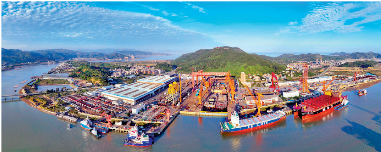
▲在對接台灣遠洋漁船靠泊及漁獲銷售方面，福州（連江）國家遠洋漁業基地已申請作為台灣遠洋漁船停泊、台灣漁獲水產品進口口岸。

另外，此番新政中強調保障台灣農漁民權益，福建早已落地多項突破性舉措。據福建省相關部門介紹，福建沿海各地都已有惠及台漁業者的相關政策。在平潭綜合實驗區，明確台胞企在漁船買賣、證書辦理、漁業捕撈等方面享有與大陸居民同等權利，創新「同窗服務、即辦即通」，台灣漁業船員憑居住證即可從業，徹底打通資格採信壁壘；寧德推出「寧台漁業融合七條措施」，覆蓋種業、養殖、保費、技術、加工、交流、保護全鏈條，台企可直接申領養殖補助。在省級層面，福建還設立漁業保險專屬優惠，台資企業投保保費直降5%，綠色技術再降5%，無理賠續保最高優惠20%，為台灣漁民在閩發展築牢風險保障，以政策兜底、權益保障、服務貼心落實同等待遇。