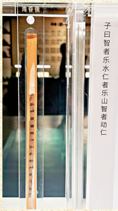
▲展出的《論語》簡。