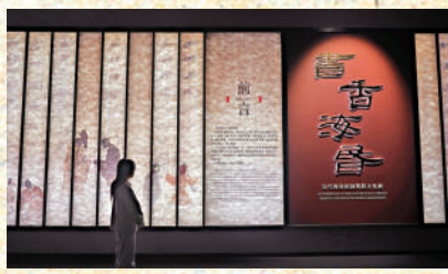
▲圖為「書香海昏——漢代海昏侯國簡牘文化展」展廳。