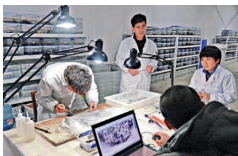
▲考古文保人員在江西海昏侯墓遺址文保用房內對出土的竹簡進行測量。

的西漢列侯墓園遺址，成為闡釋中華文明多元一體格局的重要實證。先後榮獲「中國考古六大新發現」「全國十大考古新發現」「田野考古獎」「考古遺產保護金尊獎」及第四屆「世界考古論壇獎」重大田野考古發現獎」等多項重要獎項。十年間，海昏侯劉賀墓出土文物保護修復與學術研究不斷推進，取得「最早齊《論語》」「最早中藥炮製品實物」「最早炒鋼鑄用毫針」「最早蒸餾酒器」等一批「海昏之最」成果，填補多項學術空白。2020年9月，海昏侯國遺址公園正式開放，至今已累計接待遊客達1000萬人次，成為江西乃至全國重要的文化地標與「金色名片」。