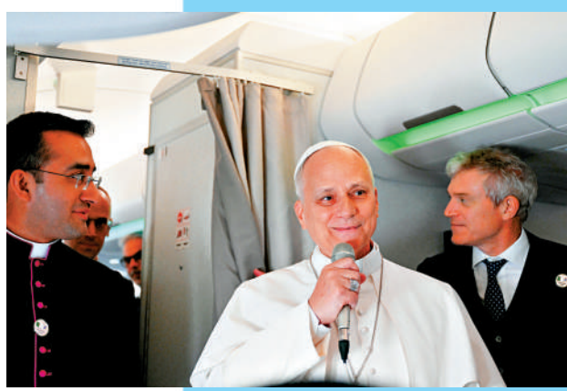
▲羅馬天主教教皇利奧十四世13日在飛機上回答記者提問。

自2月28日對伊朗開戰以來，美國總統特朗普多番語出驚人，包括揚言「消滅伊朗整個文明」、抨擊教皇、自比耶穌等，引發大批批評聲浪，其中不乏MAGA（讓美國再次偉大）陣營的知名人士。美媒稱，特朗普的種種出格言行讓一些昔日盟友開始質疑他的心智狀態，有MAGA網紅以「有種族滅絕傾向的失心瘋」來形容他，更有前盟友呼籲依憲法第25修正案將他解職。