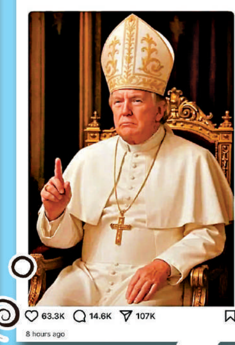
63.3K 14.6K 107K 8 hours ago