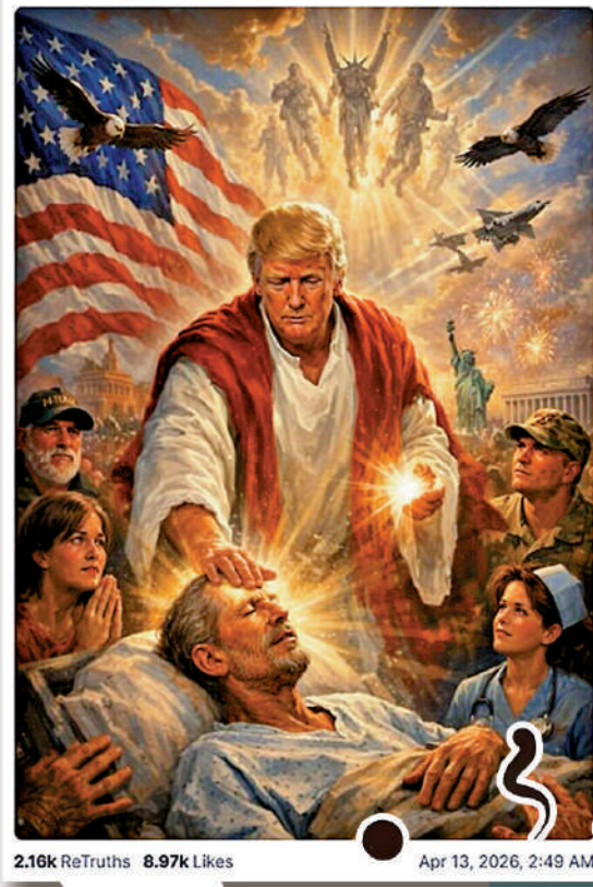
2.16k ReTruths 8.97k Likes Apr 13, 2026, 2:49 AM