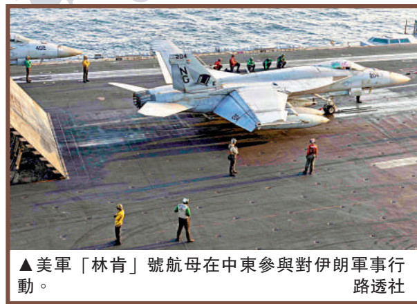
▲美軍「林肯」號航母在中東參與對伊朗軍事行動。路透社