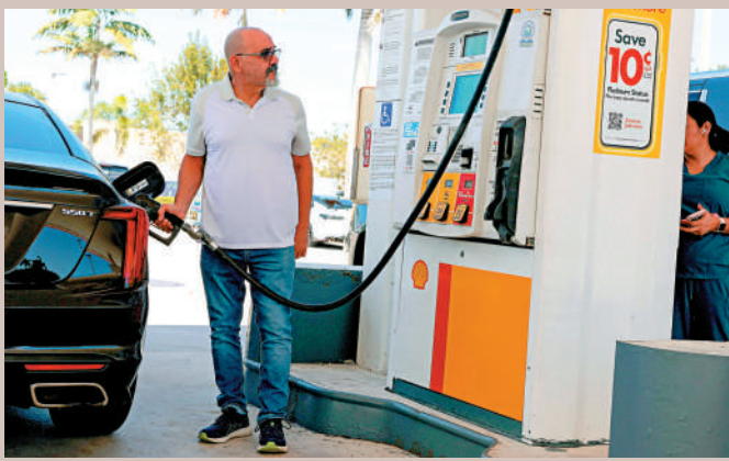
▲中東戰事推高油價，美國民眾亦感受到壓力。

彭博社稱，大部分中東和亞洲船東表示將暫停通過該海峽，直至「封鎖令」相關細節明朗化。消息人士稱，伊朗正考慮暫停霍爾木茲海峽航行，以免破壞美伊談判進程。大公報整理