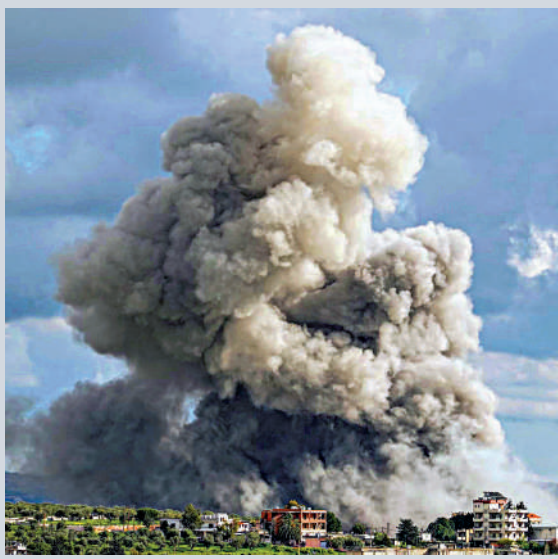
▲黎巴嫩南部地區12日遭以軍空襲。法新社

【大公報訊】綜合路透社、法新社報道：以色列和黎巴嫩政府代表14日在美國首都華盛頓舉行會談，但以軍當天仍在轟炸黎巴嫩南部。以色列拒絕與黎巴嫩真主黨討論停火，以外長薩爾聲稱，以黎之間的「問題」就在於黎巴嫩真主黨。外界普遍預計此次會談難以就結束以黎衝突達成協議。