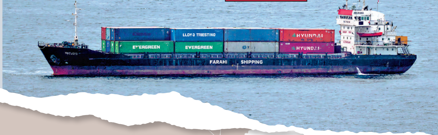
▲一艘貨船14日在波斯灣水域行駛。