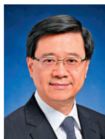
▲李家超表示，香港今天安定繁榮的良好局面來之不易，我們必須倍加珍惜。

全。今年2月10日，國務院新聞辦公室發布《「一國兩制」下香港維護國家安全的實踐》白皮書，深刻回顧了香港維護國家安全的鬥爭歷程，系統梳理了香港「由亂到治」走向「由治及興」的經驗啟示。《白皮書》強調，中央政府對香港的國家安全事務負有根本責任，香港特區負有維護國家安全的憲制責任，必須以「總體國家安全觀」為指導，把握「一國兩制」下維護國家安全的實踐要求，堅定維護國家主權、安全、發展利益，使香港的高質量發展更符合香港居民福祉、符合外來投資者利益。安全是國家生存發展的前提，維護國家安全是頭等大事。《白皮書》深刻指出，香港面臨的安全形勢依然嚴峻複雜，鬥爭依然尖銳激烈，我們必須時刻提高警覺。作為特區首長、當家人，