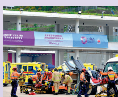
▲多個紀律部隊在每年「全民國安教育日」期間，舉行開放日活動，向市民宣傳國家安全信息。圖為消防處日前舉行開放日。

安全是發展的前提，發展是安全的保障。香港今天安定繁榮的良好局面來之不易，我們必須倍加珍惜。「十五五」規劃下香港的發展潛力優厚，機遇處處，我們要主動識變應變求變，廣泛凝聚社會共識，在改革中開創香港發展新局面，充分發揮「一國兩制」的制度優勢和重要作用，更好融入和服務國家發展大局，積極推進和參與粵港澳大灣區建設，為中國式現代化強國建設、民族復興偉業作出新的更大貢獻。