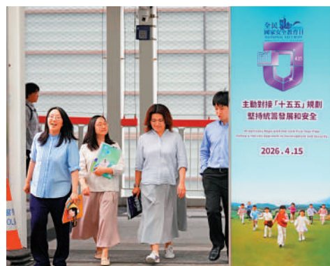
▲國家安全是社會穩定繁榮的基石，維護國家安全，構建和諧美好生活，需要大家共同努力。