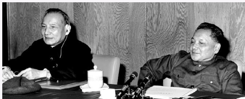
▲1978年12月，鄧小平（右）和陳雲在黨的十一屆三中全會上。

然而，要想短期內消除十年「文化大革命」在政治上思想上造成的嚴重混亂，並非一件容易的事情。這種混亂的發生，主要是由於林彪、江青兩個反革命集團的興風作浪，但也與黨內長期存在的「左」的錯誤有關。糾正這種嚴重混亂最突出的障礙，是當時提出和推行「兩個凡是」，即「凡是毛主席作出的決策，我們都堅決維護，凡是毛主席的指示，我們都始終不渝地遵循」。「兩個凡是」對毛澤東生前的決策和指示拒絕作任何分析，在理論上違背了馬克思主義基本原理和黨的實事求是的思想路線，在實踐上為新形勢下堅持真理、修正錯誤設置了障礙。