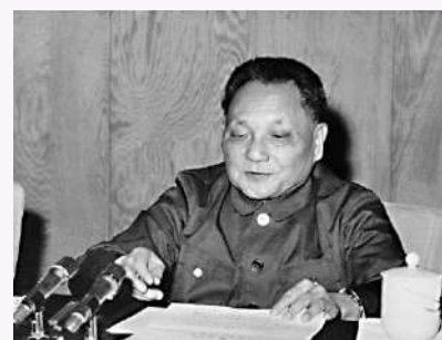
▲鄧小平重新確立了實事求是的思想路線。

「兩個凡是」提出不久，1977年4月10日，尚未恢復領導職務的鄧小平在給黨中央的信中指出：「我們必須世世代代地用準確的完整的毛澤東思想來指導我們全黨、全軍和全國人民。」此後，他在不同場合多次批評「兩個凡是」。葉劍英、陳雲、李先念、聶榮臻、徐向前等老一輩革命家也強調要發揚黨的實事求是的優良傳統，對「兩個凡是」進行了抵制。