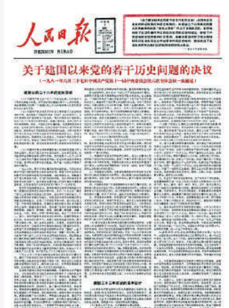
▲1981年7月1日，《人民日報》刊發《關於建國以來黨的若干歷史問題的決議》。