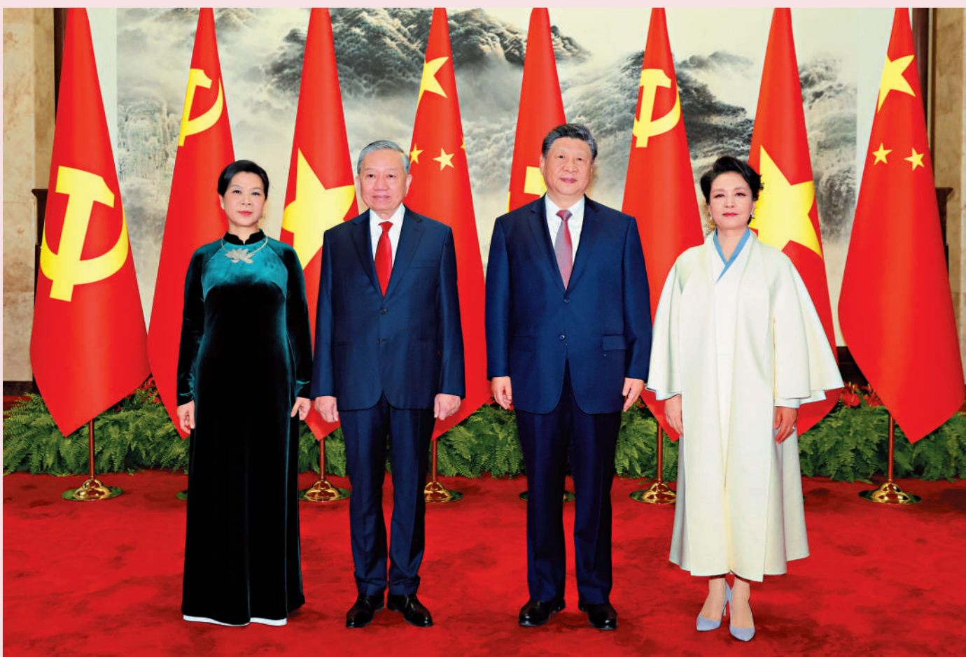
4月15日上午，中共中央總書記、國家主席習近平在北京人民大會堂同來華進行國事訪問的越共中央總書記、國家主席蘇林舉行會談。這是會談前，習近平和夫人彭麗媛同蘇林和夫人吳芳瑤合影。新華社

4月15日上午，中共中央總書記、國家主席習近平在人民大會堂同來華進行國事訪問的越共中央總書記、國家主席蘇林舉行會談。