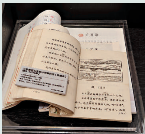
▲廣州中山大學校史館收藏展示《日月潭》一文的3本不同年代小學語文教科書。

日月潭風光秀麗，吸引了許許多多的中外遊客。 (備註：這是大陸小學二年級語文課本其中一篇課文)