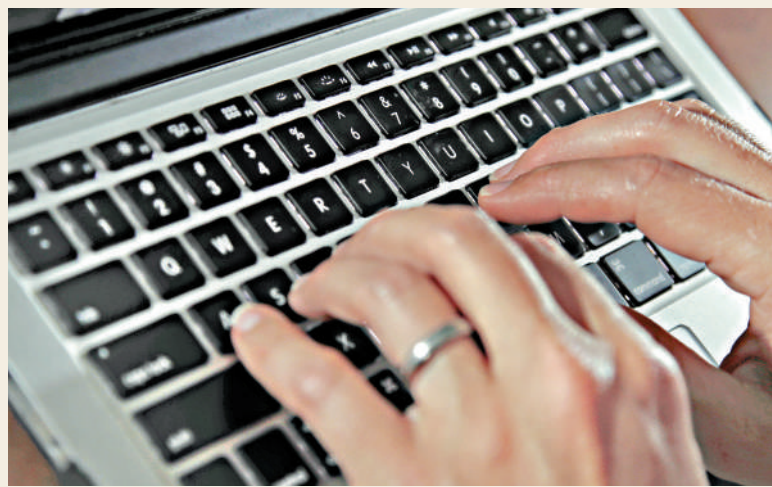
對網絡暴力說「不」，已勢在必行。資料圖片