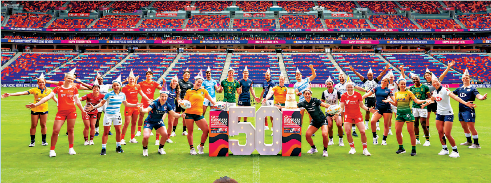
香港國際七人欖球賽踏入第50周年，參賽的30名隊長戴上生日帽拍攝大合照。