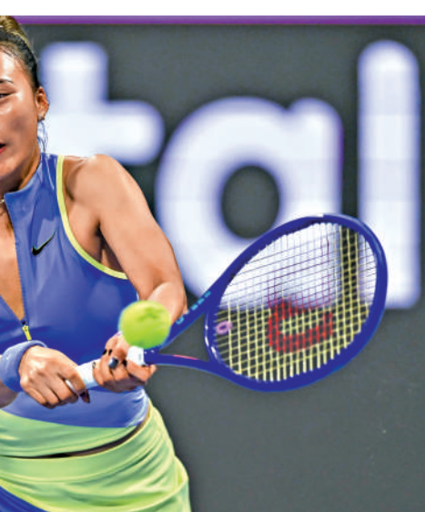
▶鄭欽文目前世界排名第37位。

張之臻曾在2023年法網創造歷史，成為公開賽時代以來首位打進紅土大滿貫賽事男單32強的中國大陸選手。