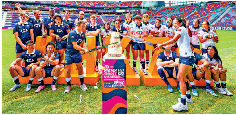
▲中國香港男子、女子七欖球隊隊長以「銀劍」切蛋糕。

啟德主場館的土落客區將會開放。由於預計離場人士眾多，輪候的士的時間會較長。觀眾可留意場地廣播和「離場易」平台（easyleave.police.gov.hk）提供的實時資訊，以及經運輸署網頁（www.td.gov.hk）、「香港出行易」流動應用程式、電台和電視台發放的最新交通消息。