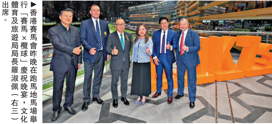
香港賽馬會昨晚在跑馬地馬場舉行「賽馬×欖球」慶祝晚宴，文化、體育及旅遊局局長羅淑佩（右三）出席。