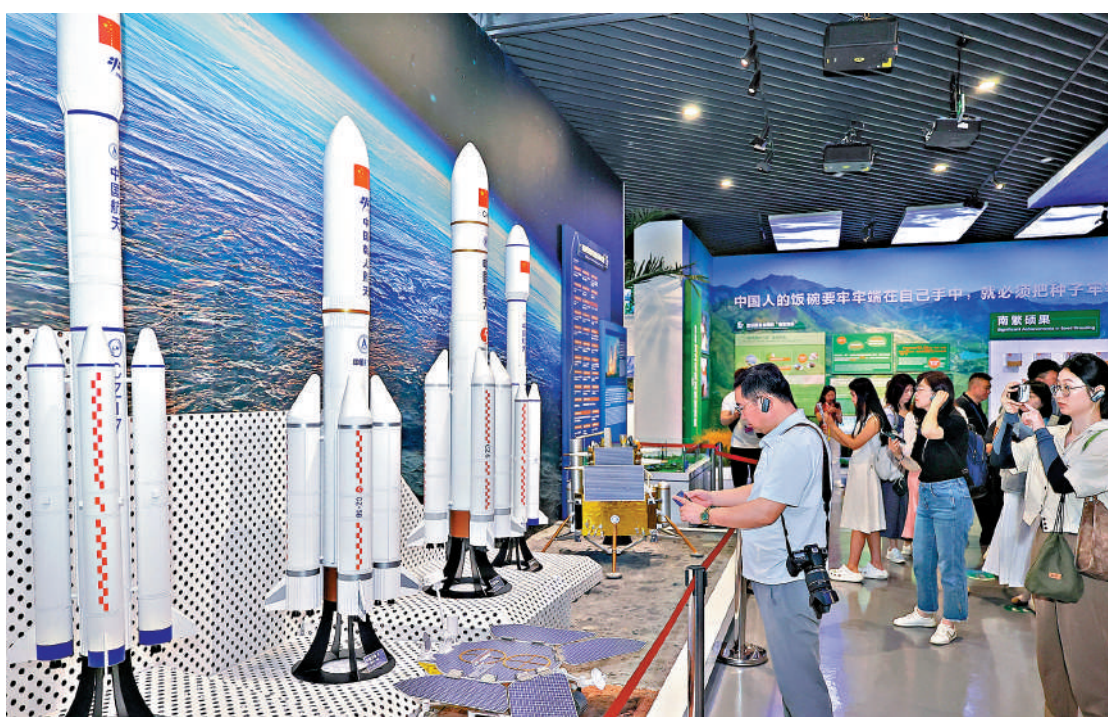
▲最近隨團訪問大陸的台灣學者表示大陸高科技迅速發展，感概台灣與大陸的差距太大了。圖為在海南省海口市舉辦的「海南的全面深化改革開放和中國特色自由貿易港建設成果展」展出的多款火箭模型。