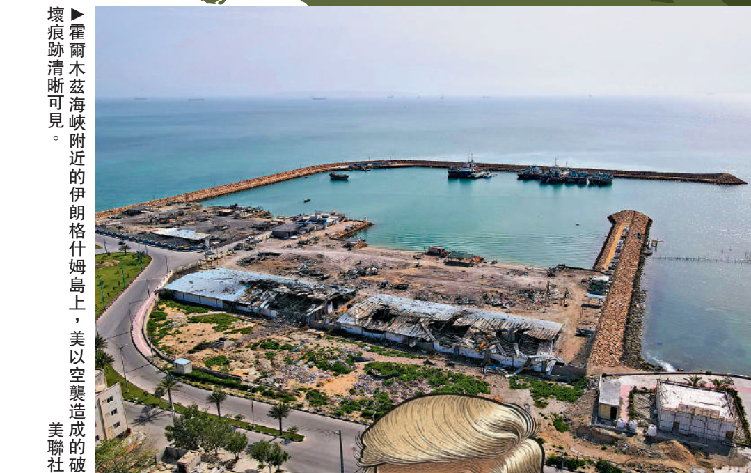
霍爾木茲海峽附近的伊朗格什姆島上，美以空襲造成的破壞痕跡清晰可見。

美軍13日起對所有進出伊朗港口的船隻實施封鎖，逾萬名美軍士兵和十多艘軍艦在阿曼灣和阿拉伯海等地參與行動，霍爾木茲海峽航運面臨新的不確定性。凱恩16日稱，截至當天上午美軍尚未登臨任何船隻。美軍中央司令部稱，沒有一艘船突破封