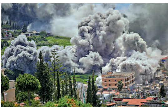
▲以軍16日仍對黎巴嫩南部地區發動空襲。

軍交火的黎巴嫩真主黨未參加。真主黨15日表示同意停火，但不接受2024年黎以簽訂停火協議後，黎方履約而以方逃避責任的局面重演。