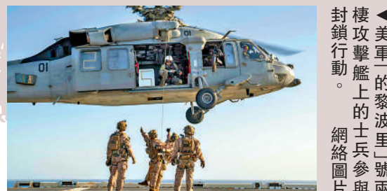
美軍「黎波里」號兩栖攻擊艦上的士兵參與封鎖行動。