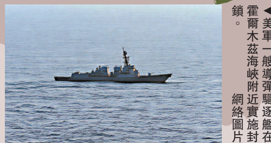
美軍一艘導彈驅逐艦在霍爾木茲海峽附近實施封鎖。

海格塞斯16日被問到是否有其他國家參與美軍封鎖行動時回答說「應該有」，但並未說出任何一個願意這麼做的國家。歐洲正嘗試組建一個將美國排除在外的聯盟，旨在恢復霍爾木茲海峽航運。英法兩國計劃17日聯合主持一場有數十個國家參與的線上會議討論此事。美媒透露，由於特朗普政府多次指責北約盟國在對伊朗軍事行動中「不幫忙」，甚至威脅退出北約，德國、英國、法國等北約主要成員國正加速推進「歐洲北約」方案，即更多地讓歐洲國家擔當北約指揮與管控角色。