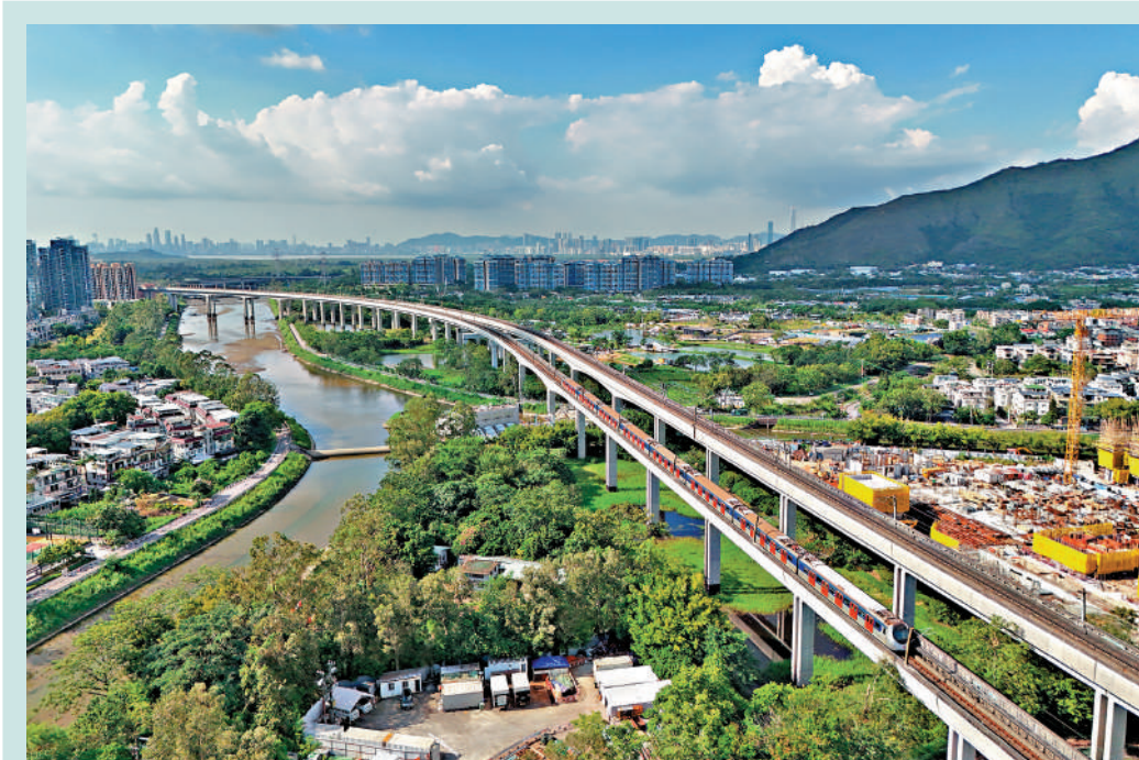
▲北環綫主線將經過凹頭，並設有中途站。

連接北環綫及東鐵線的古洞站，已於2023年率先動工，並於去年11月項項，現正進行站內裝修及機電屋宇設備安裝，預計可如期於2027年投入服務，配合古洞北新發展區主要人口遷入的時間。