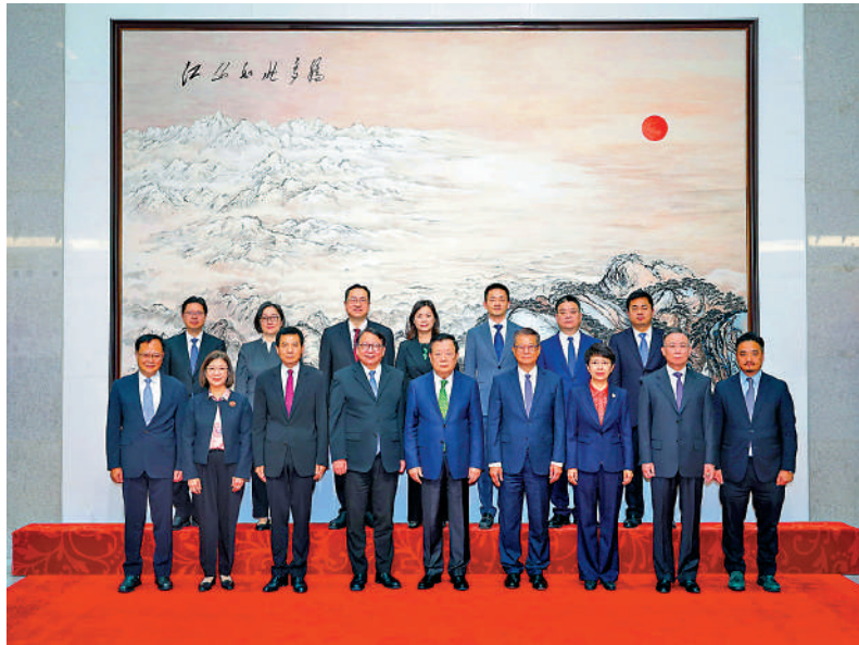
▲4月16日上午，中央港澳工作辦公室主任、國務院港澳事務辦公室主任夏寶龍在北京會見香港特區政府政務司司長陳國基、財政司司長陳茂波一行。

中央港澳工作辦公室、國務院港澳事務辦公室分管日常工作的副主任徐啟方、副主任章冬梅等參加會見和座談。