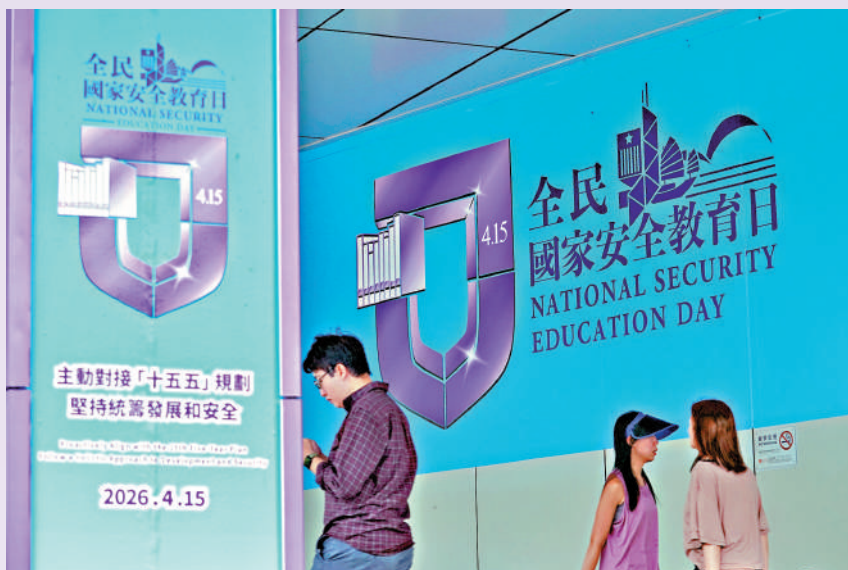
▲各政策局表示，推動安全和發展動態平衡，提升治理效能，令市民生活更加安穩。

中央港澳工作辦公室主任、國務院港澳事務辦公室主任夏寶龍15日在「全民國家安全教育日」開幕典禮上視頻致辭表示，要深入學習習近平主席重要講話精神，統籌發展和安全，以高水平安全護航香港由治及興，開創「十五五」時期「一國兩制」事業新局面。 特區政府多名局長昨日在社交平台發文指出，唯有守住國安底線，方能護航香港由治及興。各政策局將對接國家「十五五」規劃部署，制訂香港首個五年規劃，全力推動北部都會區建設，深度參與大灣區建設，切實融入國家發展大局，以高質量發展護航「一國兩制」行穩致遠。