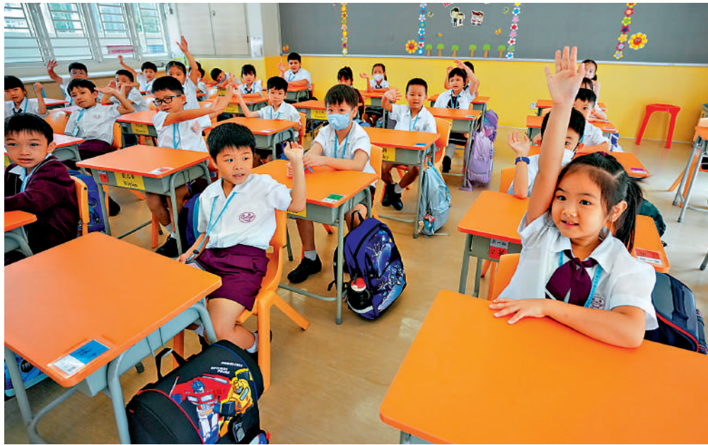
▲教育局發言人表示，《價值觀教育課程架構》（二〇二六）以「立根中華、聯通世界、擁抱未來」為總體方向。

教育局發言人表示，《課程架構》（2026）以「立根中華、聯通世界、擁抱未來」為總體方向，貫徹價值觀教育以中華文化為主軸，闡明學校應持續加強關注的價值觀教育重點、課程內容、規劃與實施策略，並就各學習階段提出對學生的學習期望建議，以及提供相關資源與支援等，為學校進一步優化價值觀教育提供更清晰和具前瞻性的方向，支援學校裝備學生，面對當前和未來的機遇和挑戰。