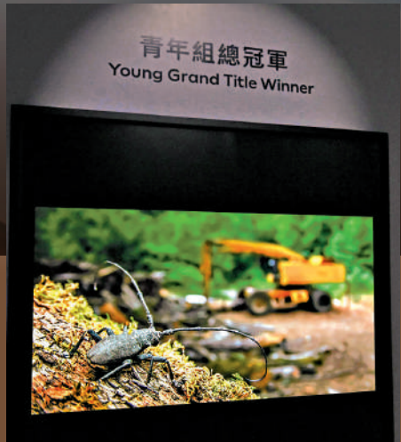
▲意大利攝影師Andrea Dominizi在「15-17歲」組，以作品《災後餘影》獲青年組總冠軍。

其他活動還包括4月18日舉辦的「科普遊樂園」，透過專人導賞、攤位遊戲和科學示範，讓參加者領略科學的趣味；4月18及26日與電影節目辦事處合作的「未來啟視」活動，播放四套富啟發性的科幻電影，包括《太空奇兵·威E》（2008）、《明日世界》（2015）、《鐵甲再生人》（1999）及《變種異煞》（1997）等。