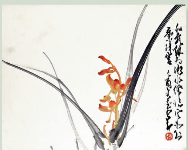
▲趙少昂作品《蘭蕙》，畫上援引詩句「和露綉為湘水佩，凌風如到蕊珠宮」，以詠蘭花的幽芳清逸。