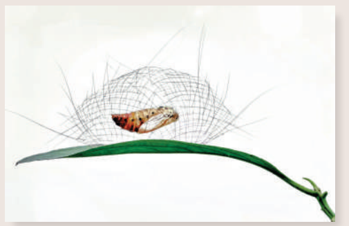
▲袁明輝攝影作品《懸空凝時》。

《同步捕獵》拍攝於福建省的簕筲湖，曾出現過污染，但隨着國家的治理工程，通過閘門系統將其重新與大海相連，調控水的流動，令此地從魚蝦絕跡到白鸞伴舞，成為一項保育範例。