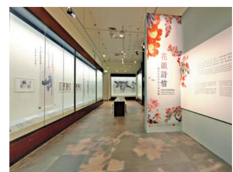
▲「花韻詩情：趙少昂花卉與自寫詩選」展覽：現正於香港文化博物館舉行。

展覽在香港文化博物館一樓趙少昂藝術館舉行，免費入場。有關展覽和活動詳情，可瀏覽香港文化博物館網頁。