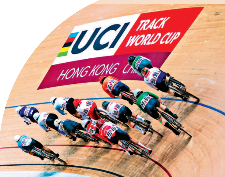
▲場地單車世界盃香港站17日在將軍澳單車館上演首天賽事。