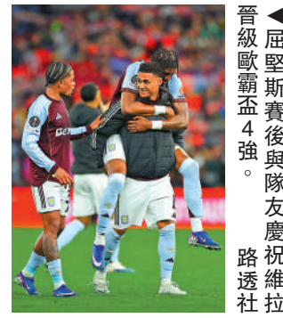
晉級歐戰盃4強。

阿士東維拉、諾定成森林及水晶宮3支出戰歐霸盃和歐協聯的英超球隊，悉數晉身4強，其中維拉與森林將於歐霸盃4強上演英超內訌，意味決賽肯定會有英超球隊，另一邊歐協聯方面，水晶宮將與前歐霸盃冠軍、烏克蘭的薩克達爭入決賽，另一邊為西甲華歷簡奴對陣法甲斯特拉斯堡。