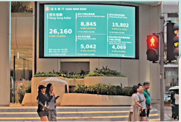
◀ 港股連升三個交易日，昨日出現回吐壓力。

永豐金融集團研究部指出，預期恒指大方向仍然平穩向上。不過，由於臨近周末，投資者傾向先行獲利平倉，鎖定利潤，因此港股出現溫和回吐，屬於正常調整。