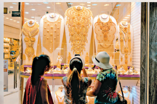
▶ 受到中東戰事影響，金價大幅波動。

【大公報訊】伊朗宣布重新開放霍爾木茲海峽後，市場憧憬美國與伊朗可能達成更全面的和平協議，國際油價一度急跌超過10%。美股道指早段曾高開1139點，報49717點；納指升幅亦曾超過1%；標指在連續兩天創下歷史新高後，早段再升1.5%。歐洲股市同樣造好。英股及德股早段升幅均曾超過1%。