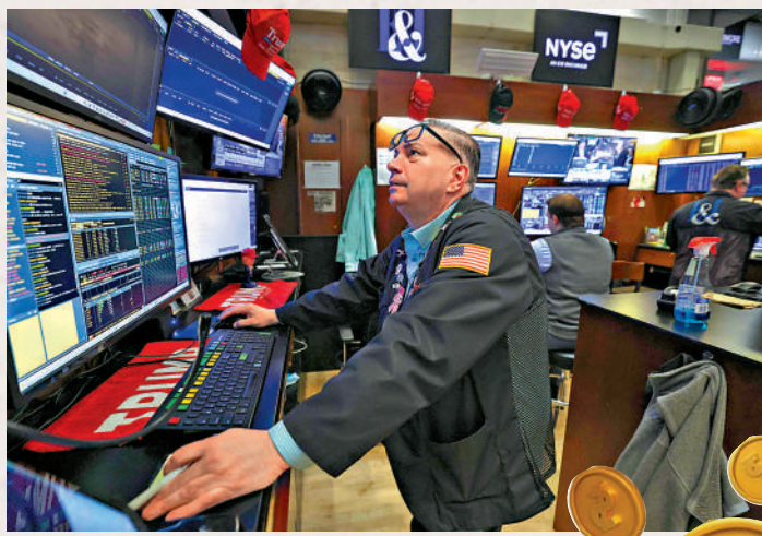
▶ 投資者對後市預期樂觀，美股升勢強勁。