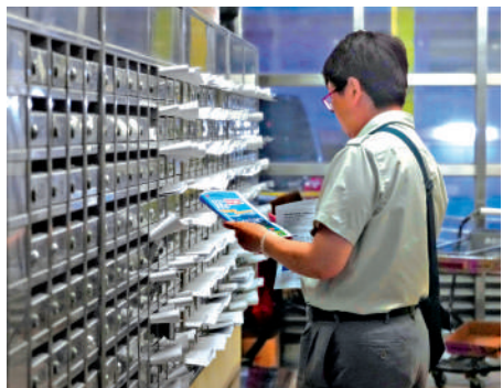
▲房署人員將重建計劃資料逐一放入信箱。

陳女士住在華富邨重建計劃第二期範圍，她希望原區安置，政府去年落實興建南港島綫西段後，她對新鐵路落成翹首以盼，「有鐵路聯通，梗係方