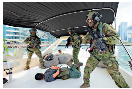
▲警務處指揮中心人員進行分析工作。