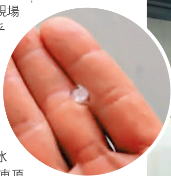
▼離島地區昨日下午一度下冰雹。

從網上影片可見，現場橫風橫雨、視野近乎零，枝葉等雜物吹至飛走，十分駭人。有附近駕駛學院的員工表示，當時現場環境惡劣，非常大風，維持5至6分鐘，事發前「個天黑晒」，更一度下冰雹，他在駕駛時，聽到車頂「霹靂啪啦」，待雨勢放緩後，他視察泊在街外的汽車情況，驚見同事的私家車被樹砸毀。