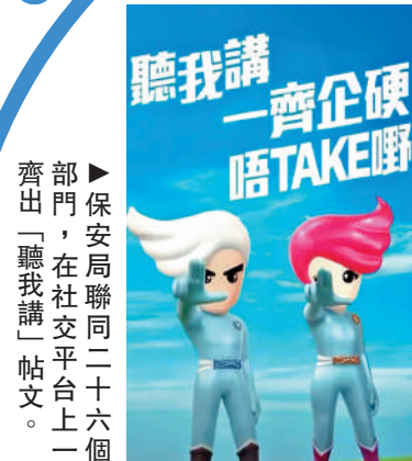
▶保安局聯同二十六個部門，在社交平台上一齊推出「聽我講」帖文。

保安局禁毒處全新的禁毒口號「聽我講：一齊企硬，唔take嘢！」已經成為時下最熱門的潮語之一。為了宣傳毒品害人，勸喻年輕人一齊企硬唔take嘢，保安局昨日聯同26個政府部門，在社交平台上一齊推出「聽我講」帖文，來自不同政府部門和紀律部隊的吉祥物齊上陣，跳出禁毒新舞步，宣傳不可不知的禁毒重要訊息。