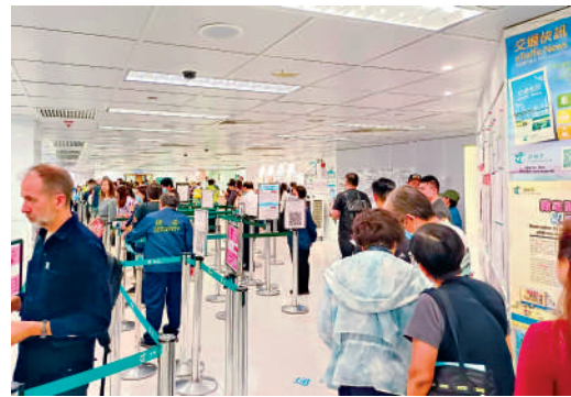
▲網上預約免試簽發香港駕照服務推出至今滿一個月，運作暢順穩定。

現時運輸署越來越多牌照服務均已實現電子化，方便市民申請，運輸署昨日在社交平台上表示，2025年經網上續領車輛牌照的比例已升至28%，較2024年約17%，增加超過6成；續領正式駕駛執照和國際駕駛許可證的網上申請比例亦分別佔48%及56%。