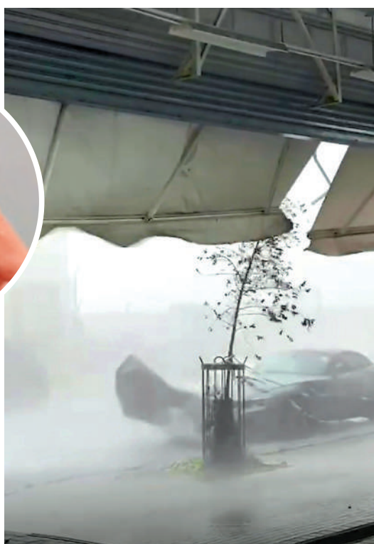
▲鴨脷洲一帶昨日下午風雲色變，利樂街橫風橫雨。

天文台表示，影響廣東的低壓槽會在今日逐漸減弱，該區驟雨減少，日間炎熱。受偏東氣流及高空擾動影響，下週初華南沿岸有幾陣驟雨。而另一道低壓槽會在下週中後期為該區帶來不穩定天氣。