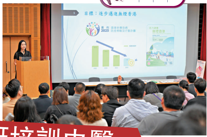
▲衛生署昨日舉辦中醫針灸戒煙服務培訓班。