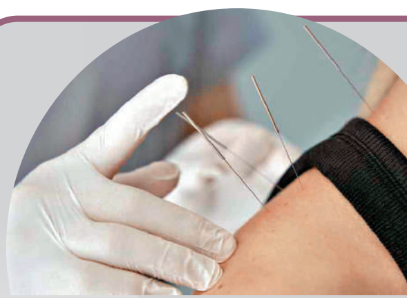
▲針灸能有效減輕戒煙癮症狀及舒緩不適。