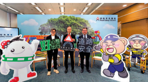
▲道路安全議會表示，將加強長者道路安全意識，並推廣乘客佩戴安全帶的習慣。

道路安全議會數據顯示，本港去年有585人因交通意外導致嚴重傷亡，92宗致命交通意外中，有51宗涉及行人，當中33宗是65歲以上長者。