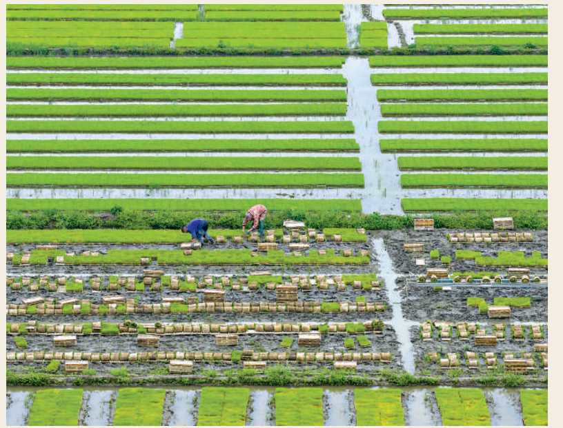
▲四月十日，浙江省餘姚市黃家埠鎮上塘村農民在田間搬運早稻秧苗。

「吃飯！」每周與兒孫一聚餐的母親說着，又讓保姆舀了點米飯到碗裏，遞給我和弟弟吃。熱騰騰的米飯光澤如月，粒粒分明，晶瑩剔透，散發着陣陣誘人的香氣。我端起飯碗，深嗅了一下那純粹帶點稻穀甘甜的田園清新，然後拿起筷子，挑起一口鬆軟的米飯送進口中含着，還是那個兒時熟悉的味道。