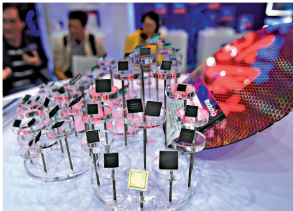
▲在霍爾木茲海峽被封鎖後，卡塔爾生產的氮氣將無法通過海運出口。氮氣價格的飆升會引發全球性的電子器件短缺。

由於氮氣的分子極小，難以完全密封，有效儲存周期僅為45天。這也意味着，氮氣供給必須依賴穩定生產與持續運輸。而今次受到中東戰爭衝擊的卡塔爾，原是全球第二大氮氣生產國（僅次於美