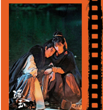
▲有觀眾認為《逐玉》談情說愛戲分佔比過重。