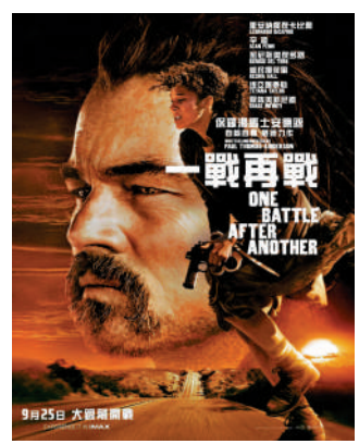
▲《一戰再戰》在第98屆奧斯卡獲得六個獎項。

添麥菲·查洛美憑《Marty Supreme：癡造之才》也獲得最佳男提名人，角色人設之爛也有不少發揮空間。偷偷摘別人老婆項鍊，等對方走後再叫酒店服務員從下水孔撈出來，自己拿去賣……可惜全程陪跑沒有得獎。