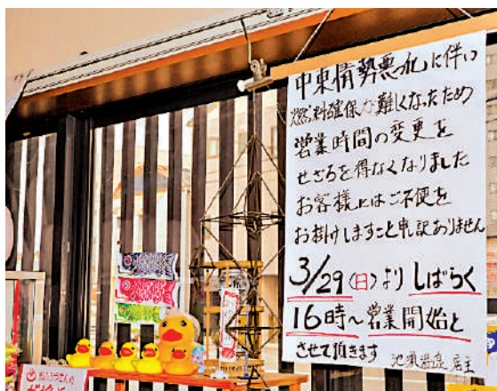
▲日本一家溫泉店張貼告示，通知顧客因燃料供給不足，將調整營業時間。

機票價格上漲也是阻礙外國遊客訪日的主要因素。由於霍爾木茲海峽航運受阻，全球航空燃油價格飆升，從2月的每桶約80美元飆升至3月下旬的超過200美元，一個月內漲幅高達2.5倍。