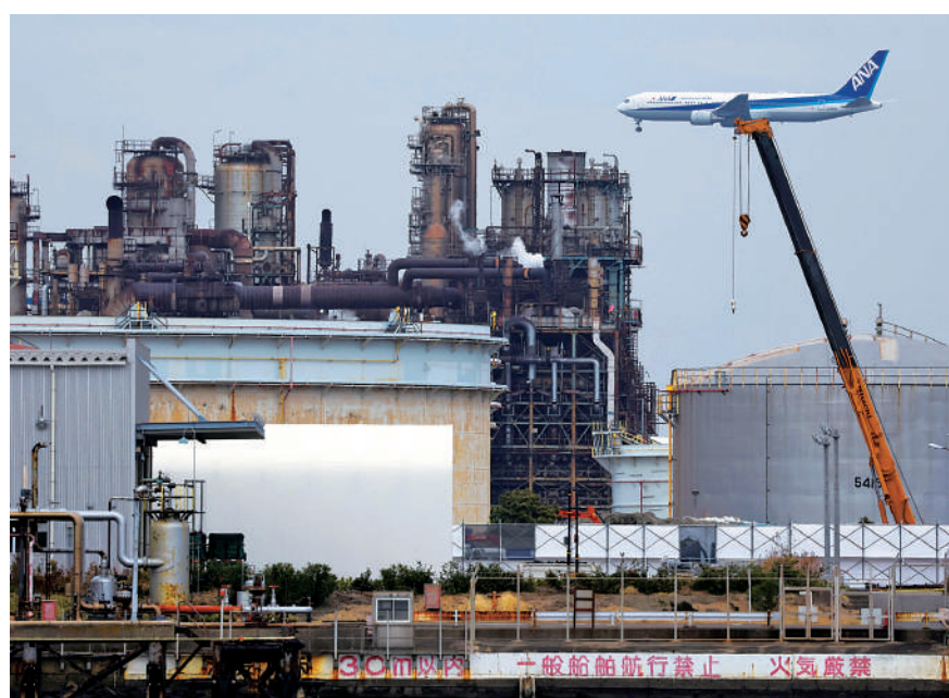
▲全日空的一架飛機即將降落在東京羽田機場。