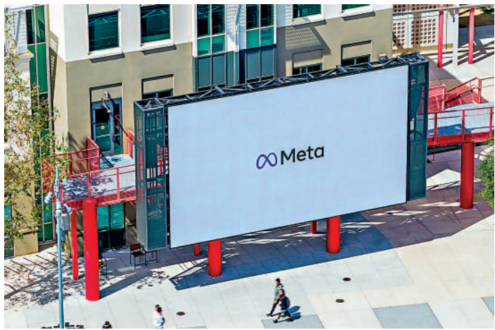
▲Meta位於加州的總部大樓。

16%。追蹤全球科技行業裁員情況的網站Layoffs.fyi報告稱，今年迄今已有7.3212萬名員工被裁，而2024年全年的這一數字為15.3萬人。