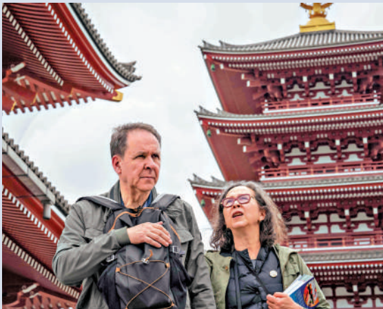
▲外國遊客在東京淺草地區觀光。