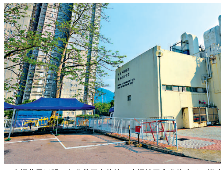
▲宏福苑居民明天起分批回家執拾，廣福社區會堂外昨日已搭建帳篷。