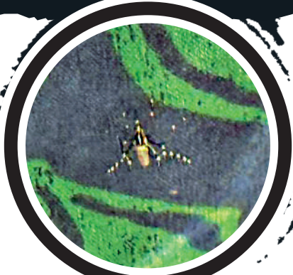
▲大公報記者現場實測，約半分鐘就有白紋伊蚊「痴上身」。