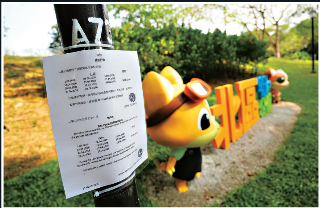
▲在北區公園，通告顯示滅蚊工作非常頻密。