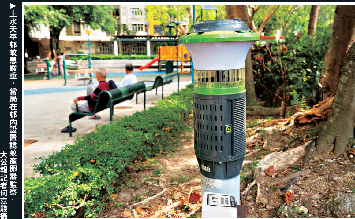
▲上水天平邨蚊患嚴重，當局在邨內設置誘蚊器產卵器監察。