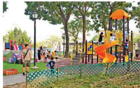
▲居民帶同小朋友到公園玩耍時，都噴好蚊怕水預防。