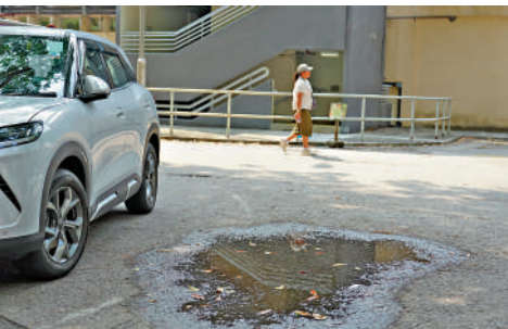
▲在天平邨可見有地方出現積水。

食環署前日公布，4月份第二批涵蓋一個監察地區的第一階段誘蚊器指數及七個監察地區的分區誘蚊器指數，除了上水的第一階段誘蚊器指數錄得21.3%，其餘都在10%以下。上水誘蚊器的數據顯示，蚊患較多的地方包括公園、學校、公共屋邨及村屋。按因應基孔肯雅熱情況而實施的安排，即是將原先在分區誘蚊器指數達20%時進行的強化控蚊工作，擴展至誘蚊器指數介乎10%至20%的區域，食環署正聯同有關部門及持份者，找出蚊患情況較高的地點，進行密集且具針對性的控蚊工作。