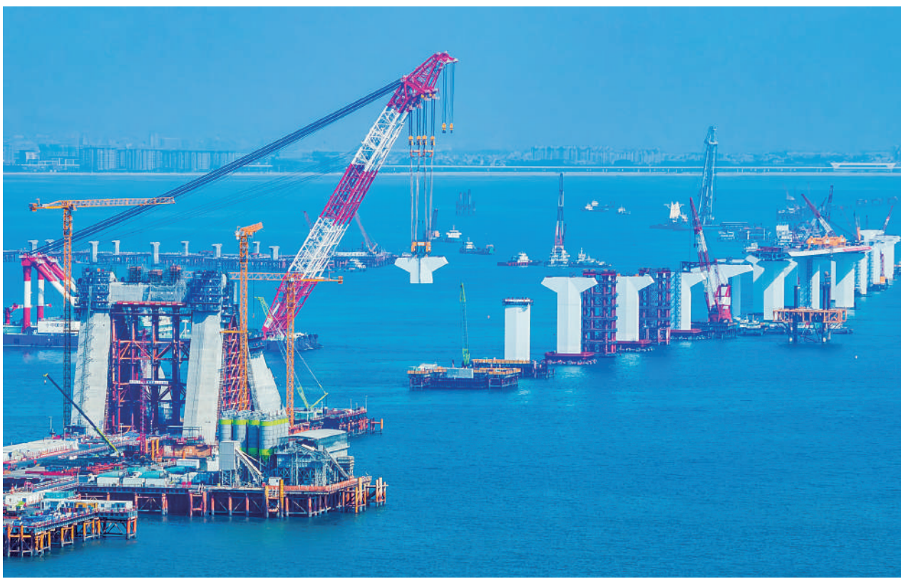
大陸最近發布的十項惠台政策措施，明確提出推動福建沿海地區在條件具備情況下同金門、馬祖通水、通電、通氣、通橋。圖為廈金大橋（廈門段）進行施工。

台媒注意到，大陸首部為促進兩岸標準共通制定的地方性法規《福建省促進兩岸標準共通條例》去年經福建省人大常委會表決通過，2026年1月1日起施行。《條例》為「小三通」邁向「新四通」打下堅實的基礎，是兩岸標準共通從實踐探索到法治保障的關鍵跨越。