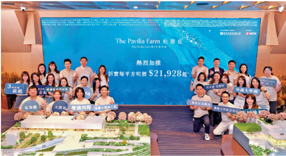
▲大圍站柏傲莊III重售88伙沽清，即晚加推75伙。

折實入場費 789 萬 柏傲莊III過去周六以價單形式重售88伙即日售罄，套現逾9.5億元，最高成交呎價達25993元。發展商打鐵趁熱，當晚再上載1B、2B、3B及4A號價單，更新75個單位售價，包括27伙一房及48伙兩房戶，實用面積307至534方呎，加價後定價986.7萬至1800.3萬元，扣除最高折扣20%後，折實價789.3萬至1440.2萬元，折實實呎21928至27368元。 若與舊價單對比，最新售價較2021年推盤時調升約3.3%至23.2%，當中有46伙加幅達1成或以上，例如3B號價單的1B座33樓C室2房戶，實用面積534方呎，最新定價1702.4萬元，較2021年6月的1424萬元大幅調升278.4萬或19.6%，最新折實價約