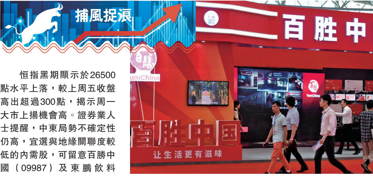
▲中東局勢對百勝中國影響相對少，加上五一黃金周將至，集團旗艦餐飲品牌肯德基及必勝客將受惠。

恒指黑期顯示於26500點水平上落，較上周五收盤高出超過300點，揭示周一上市揚機會高。證券業人士提醒，中東局勢不確定性仍高，宜選與地緣關聯度較低的內需股，可留意百勝中國(09987)及東鵬飲料(09980)，看好金價表現可低吸紫金(02899)。