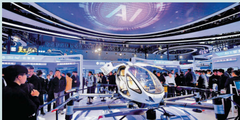
▲內地數字經濟規模穩居世界第二。圖為去年在石家莊舉行的中國國際數字經濟博覽會。