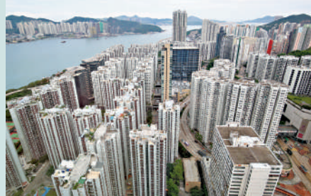
▲買家申請按揭保險計劃，物業必須為自住用途。