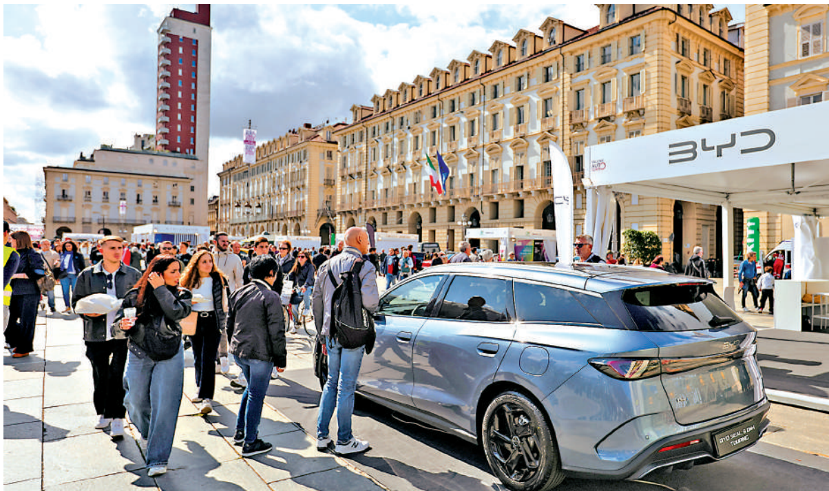
▲新車等製造企業是「出海」的主要力量，在國際市場的份額加快提升。