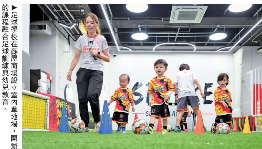
►足球學校在蘇屋商場設立室內草地場，開辦的課程融合足球訓練與幼兒教育。

不論採用「兩地兩檢」或「一地兩檢」，旅客通常需依序辦理香港及內地的出入境手續，排兩次隊、檢查兩次證件。而新的「合作查驗、一次放行」查驗模式，將出入境雙方的自助通道／櫃檯在兩地口岸邊界線上並排建立，旅客只需排一次隊、檢查一次證件便可經過過出境雙方的檢查區域完成兩地的出入境手續。