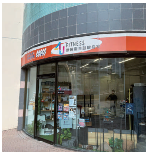
▲青年以優惠租金在房協北角健康村舖位經營健身室。

【大公報訊】記者張騰報道：香港店舖普遍租金昂貴，為幫助有志創業的青年一展抱負，香港房屋委員會早前推出的「共築·創業家2.0」計劃，與商界夥伴和商場業主提供免租金舖位。有參與計劃的年輕人，在優惠租金下，創立香港首間運動共融社企，建構共融健身文化；有青年創立教育平台，提供優惠價的興趣班，培養兒童的建築設計創意思維，有小朋友說參與興趣班後，有志將來修讀建築專業。有本地足球學校在商場設立室內草地足球場，融合足球與幼兒教育。