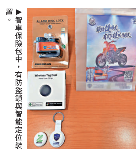
►智車保險包中，有防盜鎖與智能定位裝置。

親身經歷，數年前有租客未有將車輛歸還，並且失去聯絡，他隨即報警求助，幸得車上設有全球定位系統（GPS）追蹤，及後發現車輛的車牌及顏色被竊賊更改，若非能夠掌握具體位置，根本無法辨識以尋回車輛。他認為，電單車的防盜性較其他車輛低，「智車保計劃」如同為電單車車主添加了一份保險。