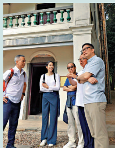
▲鄧炳強昨早帶團到蓮麻坑邊境禁區路段考察。