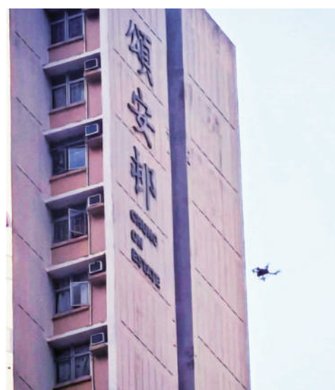
▲警方首出動無人機協助打擊街頭賭博，在馬鞍山頌安邨拘捕8男女。

根據香港法例第148章《賭博條例》，任何人於街道上進行非法賭博，一經定罪，最高可罰款5萬元及監禁9個月。