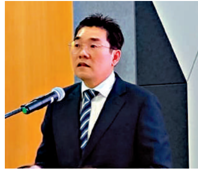
▲沈志勤強調，應對供應鏈過度集中脆弱性，在於「多元化」與「能力提升」的結合。

香港生產力促進局（HKPC）與馬來西亞製造業聯合總會（FMM）合作備忘錄簽署儀式昨日在吉隆坡舉行。馬來西亞投資、貿易及工業部副部長沈志勤致辭時表示，馬來西亞與香港擁有數十年的深厚商業友誼，馬來西亞2025年對香港出口同比增長8.4%，達到962.3億令吉（約1905.3億港元），相信增長得益於過去東盟與香港簽訂自由貿易協定及相關的投資協定。