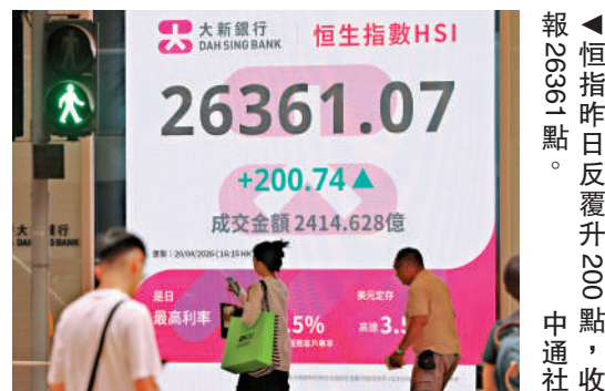
▲恒指昨日反覆升200點，收報26361點。中通社

應」、電商競爭下影響，抵銷能源、材料、工業、半導體和醫療保健等領域的穩健漲幅。此外，受指數編制影響，表現較好的科技上游公司在指數中權重不足，導致整體表現被低估。然而，大摩提醒，市場短線表現面臨阻力，因為中東區域局勢存在不確定性，而且企業盈利面臨下調，MINIMAX在IPO股份7月初解禁，所以大市波動性持續至5月到7月。