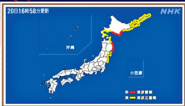
▶紅色為海嘯警報，黃色為海嘯注意警報。

【大公報訊】據日本氣象廳消息，當地時間20日16時53分左右，日本東部岩手縣附近三陸海岸發生7.4級地震，震源深度10公里，東京及周邊地區亦有震感。日本氣象廳隨後將地震震級調整至7.5級，晚上再上調至7.7級。日本氣象廳亦針對北海道、青森縣、岩手縣等地沿海地區發布不同等級的海嘯警報或提醒，稱岩手縣及北海道中部太平洋沿岸可能出現3米高海嘯，要求民眾立即撤離。