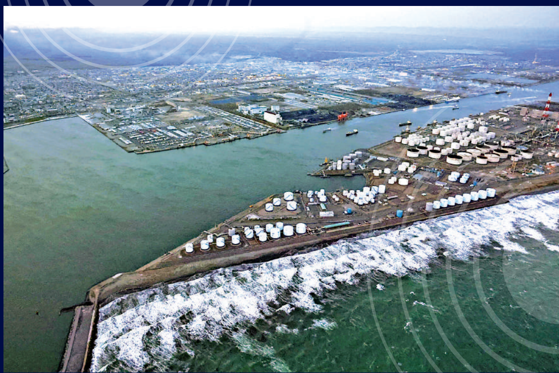
▲地震後，日本北海道苦小牧市附近的海岸線現湧浪。