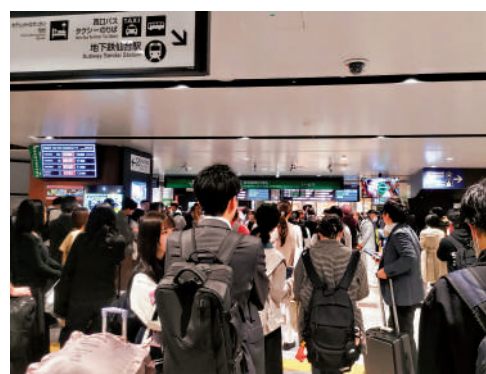
▲20日地震後新幹線列車停駛，仙台站內大量旅客行程受影響。法新社