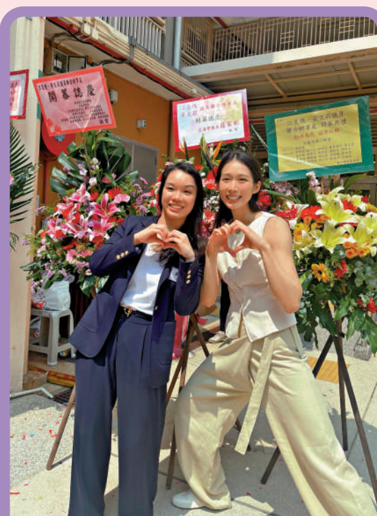
▲江旻德（右）與黃文莉日前於聯合辦事處開幕時留影。

黃文莉又說，18日開幕當日，不少市民見到江旻德都相當驚喜，「她是很多年輕人的偶像，大家見到她都好開心」。未來不排除安排更多面對面交流，日常街站活動若時間許可，也會邀請江旻德一同參與。