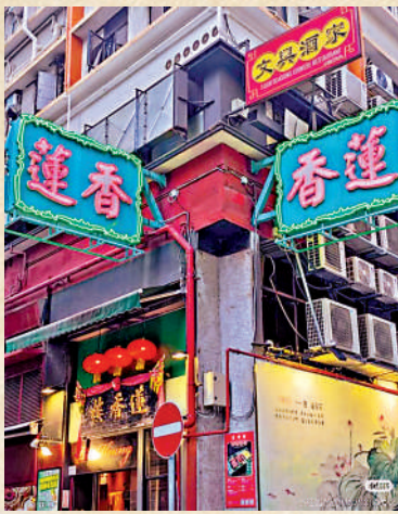
▲霓虹燈招牌字「蓮香」，每到夜晚都會亮起。

香港蓮香樓高兩層，中間有寬大木樓梯上2樓茶室，大廳四面裝有中國古文詩句、山水字畫，不設貴賓房，招牌點心為豬腩燒麥、手掌般大小的蜜汁叉燒包、蛋黃蓮蓉包等。如今依然保留搭枱的飲食風俗，手推點心車穿行其間，吸引南來北往的茶客。