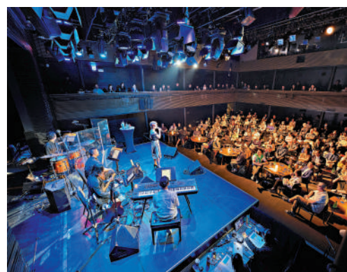
▲「西九夜延場」在茶館劇場呈獻多元風格的卡巴萊(Cabaret)演出。

戲曲中心中庭將於5月30日起舉行為期九天的「Happy Hour」活動，送上連場免費現場表演。了解更多節目詳情，可瀏覽西九文化區官方網站。