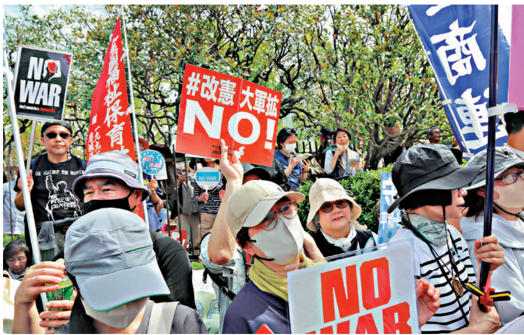
4月19日，超3萬名日本民眾在位於東京的國會議事堂前集會，抗議高市早苗政府強推修憲、企圖解禁被殺傷性武器出口等破壞和平憲法的動向。

郭嘉昆昨日在例會上強調，忘記歷史就意味着背叛，否認罪責就意味着重犯。國際社會必須高度警惕日本「歷史修正主義」的伎倆，共同遏制日本「新型軍國主義」的妄動，共同努力維護地區和世界的和平穩定。韓國外交部表示，韓國政府對日本高層當天向供奉二戰甲級戰犯的靖國神社供奉祭品深表失望和遺憾，敦促日方高層正視歷史，以行動體現對侵略歷史的謙卑懺悔和真誠反思。