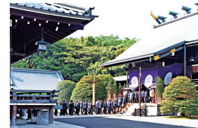
紀錄顯示高市早苗是靖國神社「常客」。