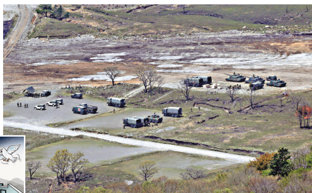
高市政府「鬆綁」殺傷性武器出口，加速日本再軍事化。

4月21日上午，日本大分縣陸上自衛隊一日出生台演習場發生彈藥爆炸事故，造成3人死亡、1人重傷。