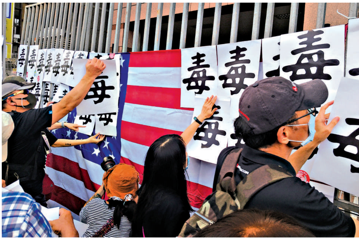
▲民進黨當局放寬美國發芽馬鈴薯進口，引發台灣社會強烈批評。圖為台灣民眾抗議民進黨當局為討好美國一再放寬進口美國食品的安全標準。資料圖片

凡是關乎美國，民進黨當局就強調「彈性與合作」，食品安全早就不再是為民眾保駕護航的底線，而是可以隨時調整的政治工具。當連最基本的風險意識都能被話術包裝、被支持者合理化、被官員技術化，台灣民眾就會發現，官方嘴上的安全，反而成了不安的來源。