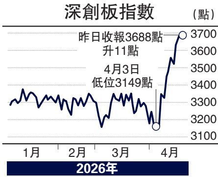
中國創新發展取得成效，深圳創業板指數有力挑戰歷史高位。