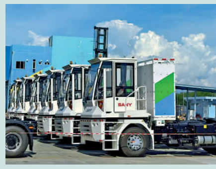
三一重工是中國工程機械製造商龍頭。

集團預期純電動重卡市場滲透率將高速增長，今年或突破50%；以舊換新政策疊加新能源重卡的經濟性優勢，已激發市場終端需求，而行業下一階段的核心推動因素是「無人化電動重卡」，可望進一步降低約30%的物流成本。