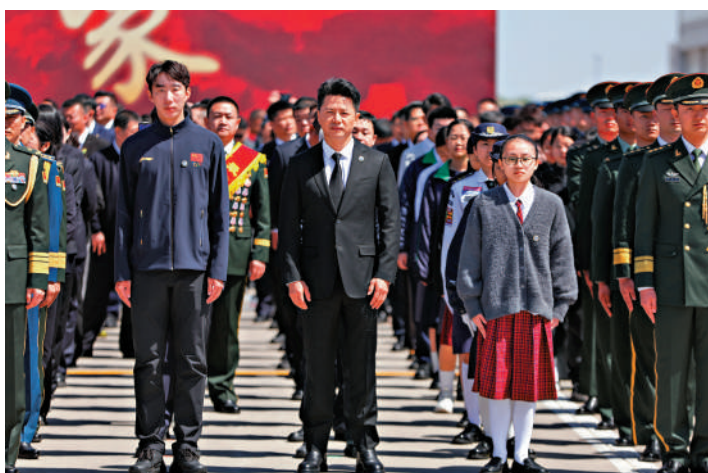
▲港澳師生代表（右數第二列）在瀋陽桃仙機場列隊，肅穆迎接烈士遺骸歸國。