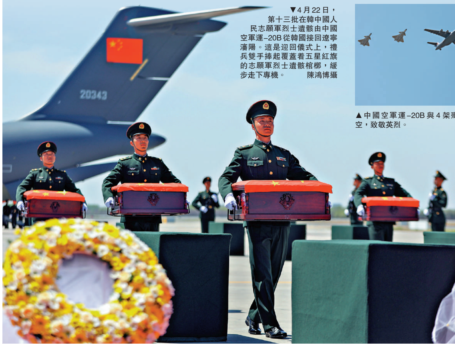
▼4月22日，第十三批在韓中國人民志願軍烈士遺骸由中國空軍運-20B從韓國接回遼寧瀋陽。這是迎回儀式上，禮兵雙手捧起覆蓋着五星紅旗的志願軍烈士遺骸棺槨，緩步走下專機。