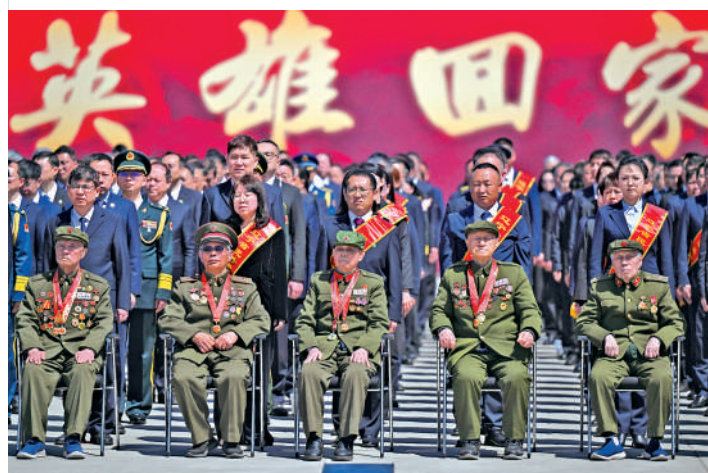
▲第十三批在韓中國人民志願軍烈士遺骸回國迎回儀式現場。

自2014年以來，中韓雙方遵循國際法和人道主義原則，已連續成功交接13批共1023位在韓中國人民志願軍烈士遺骸。