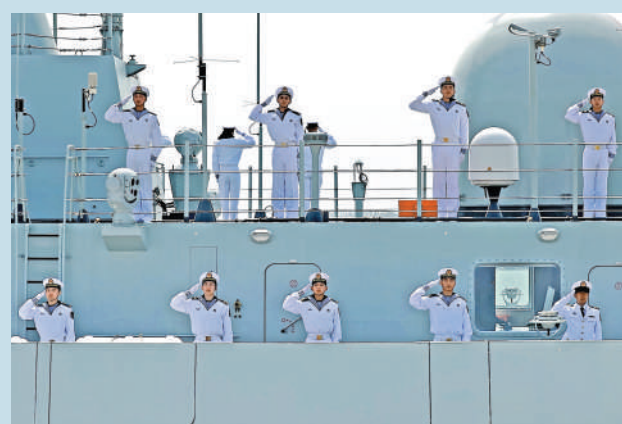
▲海軍首次以最高禮儀迎接烈士遺骸歸國。圖為鄂爾多斯艦官兵敬禮。

闊別祖國70餘年的英雄回到祖國懷抱。22日11時25分，接運第十三批12位在韓中國人民志願軍烈士遺骸的中國空軍運-20B，在4架殲-20護航下，降落在瀋陽桃仙國際機場。機場以航空最高禮儀「過水門」儀式為志願軍烈士英靈洗塵。此前，運-20B飛臨位於旅順軍港上空時，海軍首次以滿旗最高禮儀迎接烈士遺骸歸國。