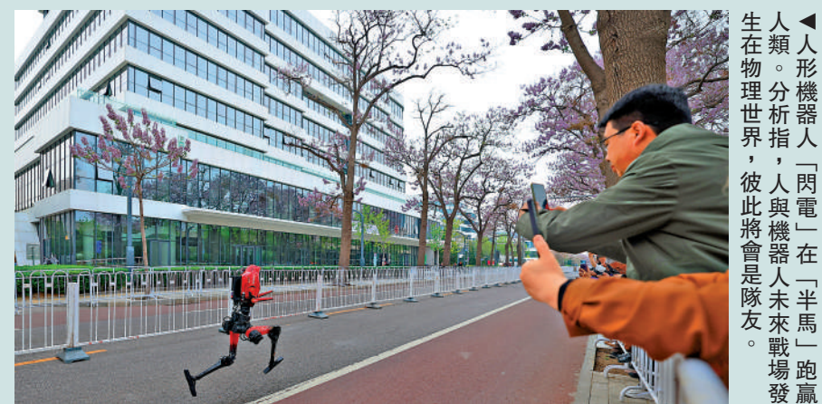
▲人形機器人「閃電」在「半馬」跑場發人。分析指，人與機器未來戰場發生在物理世界，彼此將會是隊友。