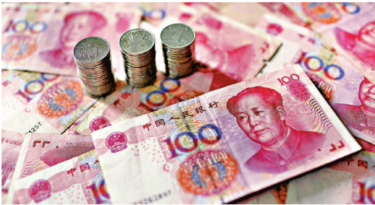
▲保持人民幣匯率在合理均衡水平基本穩定，有利於促進跨境直接投資的雙向合作空間。