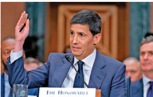
▲沃什21日在美國國會參議院出席聽證會。

美國國會近日深陷道德醜聞，上周以來已有3名眾議員辭職。21日，民主黨籍眾議員舍菲勒斯—麥考密克宣布辭職，她此前被控把數百萬美元救災資金挪作政治用途。上周，共和黨籍眾議員岡薩雷斯和民主黨籍眾議員、前加州州長熱門候選人斯沃韋爾因捲入性醜聞先後辭職。