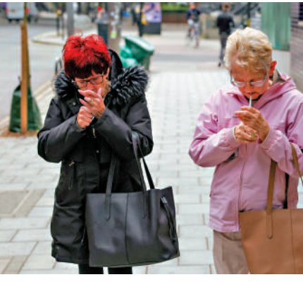
▲英國將實施更嚴格的禁煙法律。圖為兩名女子在倫敦街頭吸煙。

【大公報訊】綜合BBC、德國之聲報道：當地時間20日，英國議會審議通過《煙草與電子煙法案》。新法規