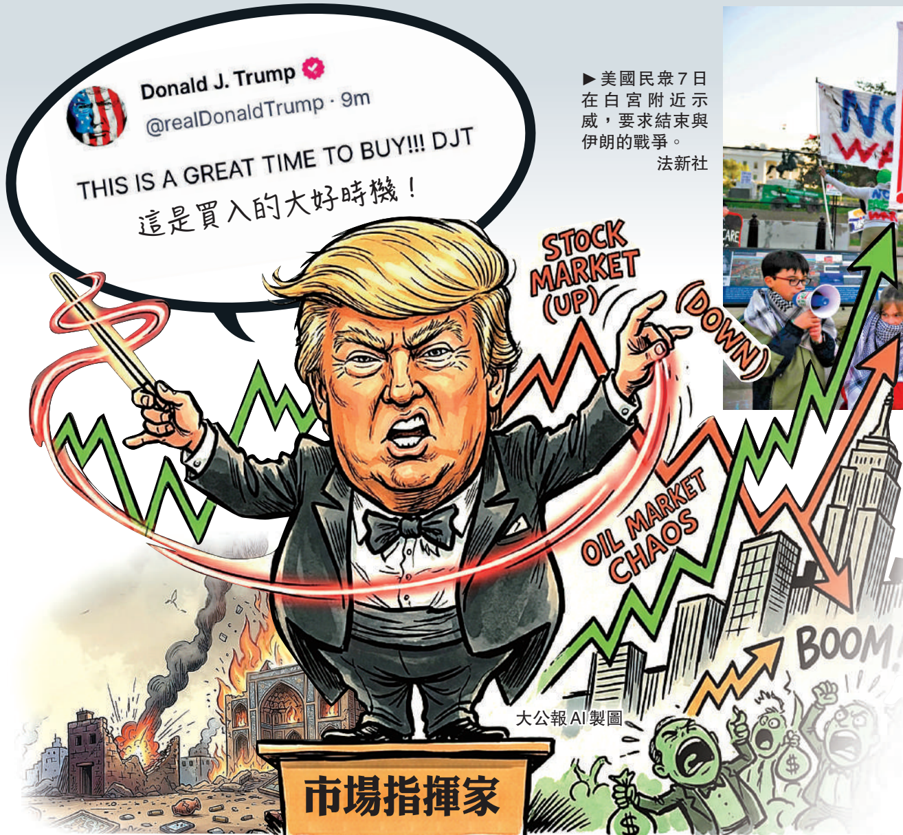
美國民眾7日在白宮附近示威，要求結束與伊朗的戰爭。