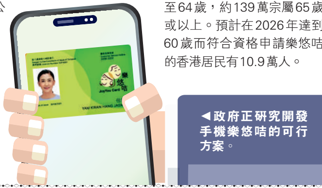
▲政府正研究開發手機樂悠咭的可行方案。

根據政府數字，截至今年2月底，樂悠咭申請共有約268萬宗，當中約129萬宗的申請人為60至64歲，約139萬宗屬65歲或以上。預計在2026年達到60歲而符合資格申請樂悠咭的香港居民有10.9萬人。