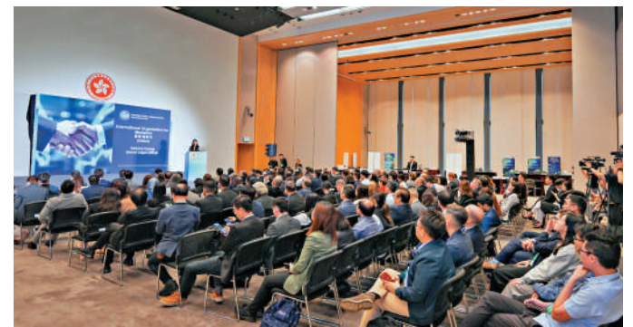
▲「一帶一路」能力建設平台交流會昨日舉行，在香港的不同機構的代表介紹他們在能力建設等方面的工作。

約30個「一帶一路」國家駐港總領事館、名譽領事館及商會等的代表出席交流會，了解平台和提供予「一帶一路」國家人員的能力建設活動，並交流意見和探索合作機會。來自香港國際航空學院、香港生產力促進局及新成立的「一帶一路」可持續綠色發展培訓中心的代表分享他們提供的能力建設活動，以及與「一帶一路」夥伴的協作等。國際調解院的代表亦介紹了推廣以調解及其他方式解決爭議的工作。