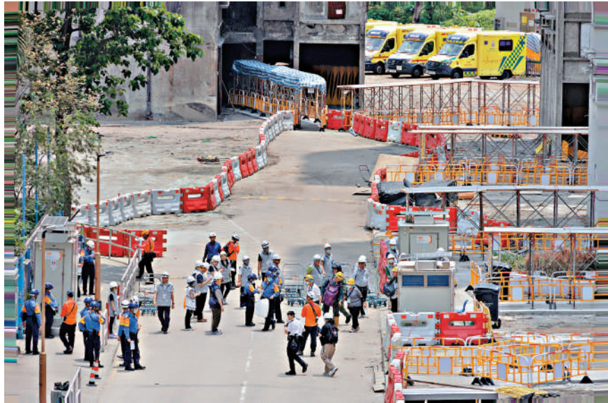
大埔宏福苑宏福閣 11 個高樓層的居民昨日回家執拾。

政務司副司長卓永興昨日視察宏福苑居民上樓安排，為工作人員打氣。政府昨日表示，上樓秩序良好，運作大致暢順。昨日有 78 戶共 264 人上樓執拾，