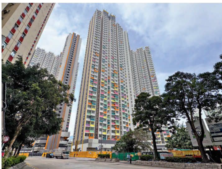
綠置居以市價六折推售九龍灣盛緻苑逾八百個單位。