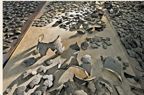
▲浙江寧波井頭山遺址文物庫房內展示的第一期發掘出土的陶片。