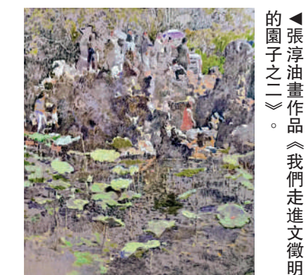
▲張淳油畫作品《我們走進文徵明的園子之二》。

張淳筆下的園林，遠非復刻古畫，而是以當下語彙再思古典之美。他不再沿用傳統文人畫園林的淡墨簡筆，轉而運用西方油畫、水彩的豐富色彩與肌理，重構園林的空間與意境。畫中園林在色塊與筆觸的往來互動中若隱若現，湖石與花木在光影與色彩的變幻中，充滿生命的律動和想像。東方美學的含蓄與西方藝術色彩及情緒的張力，在畫中互為映照。觀眾彷彿真的走進了