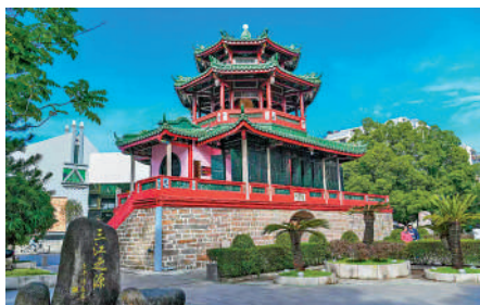
▲揭陽古城彷彿一幅緩緩展開的水墨長卷。

穿行於打銅街、中山路的騎樓群，南洋風情與潮汕韻味在此交織相融。斑駁牆面留着歲月痕跡，雕花窗櫺藏着往昔精緻，廊下陰影裏，依稀可聞舊時商賈的吆喝與匠人揮錘的回響。如今的騎樓，依舊商舖櫛比，老茶鋪氤氳着單叢的清香，小吃攤升騰着熱騰騰的煙火氣。老者閑坐門口，蒲扇輕搖，閒話家