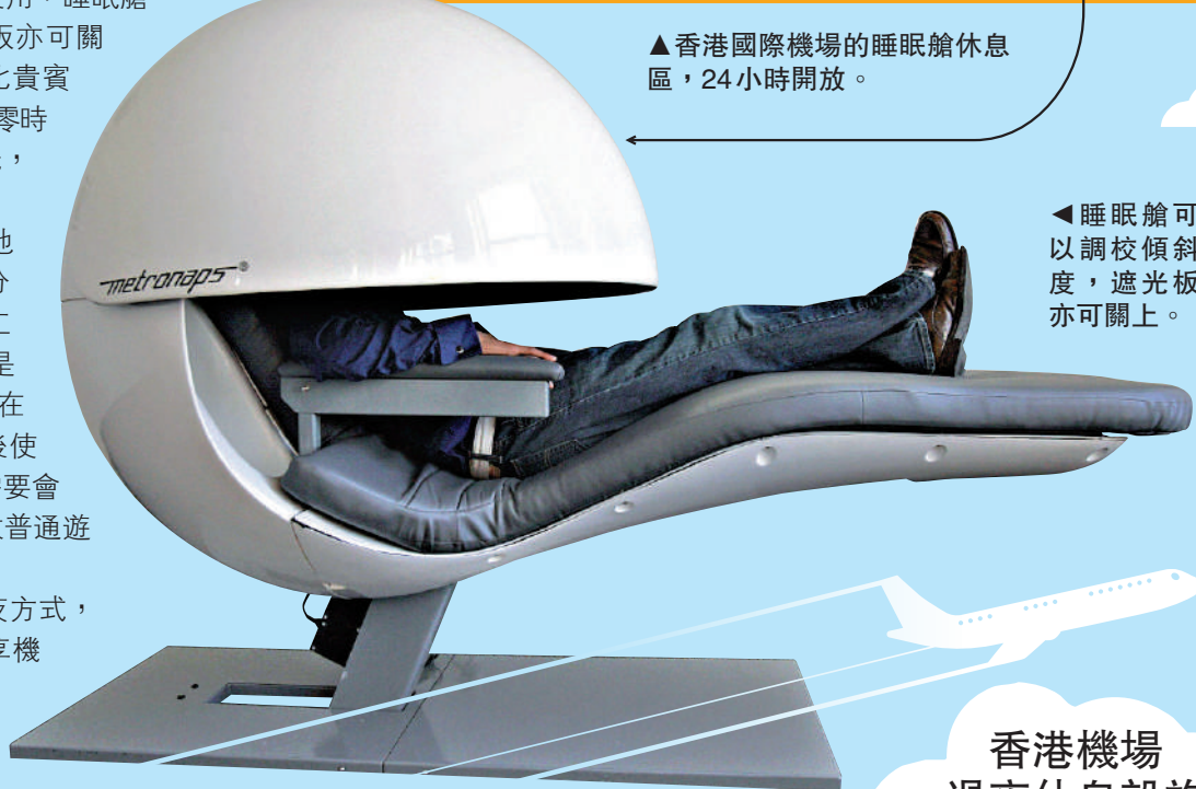
▲睡眠艙可以調校傾斜度，遮光板亦可關上。