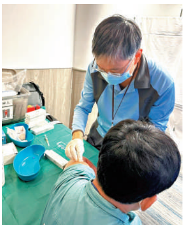
▲衛生防護中心職員為在機場工作的密切接觸者進行評估及接種疫苗。

其中約900人為非本地出生人士；約三成員工不清楚對麻疹是否具有免疫力。為防止疫情擴散，中心已為該公司超過370名員工補種麻疹疫苗，截至前日，未發現密切接觸者之間出現第二代傳播。