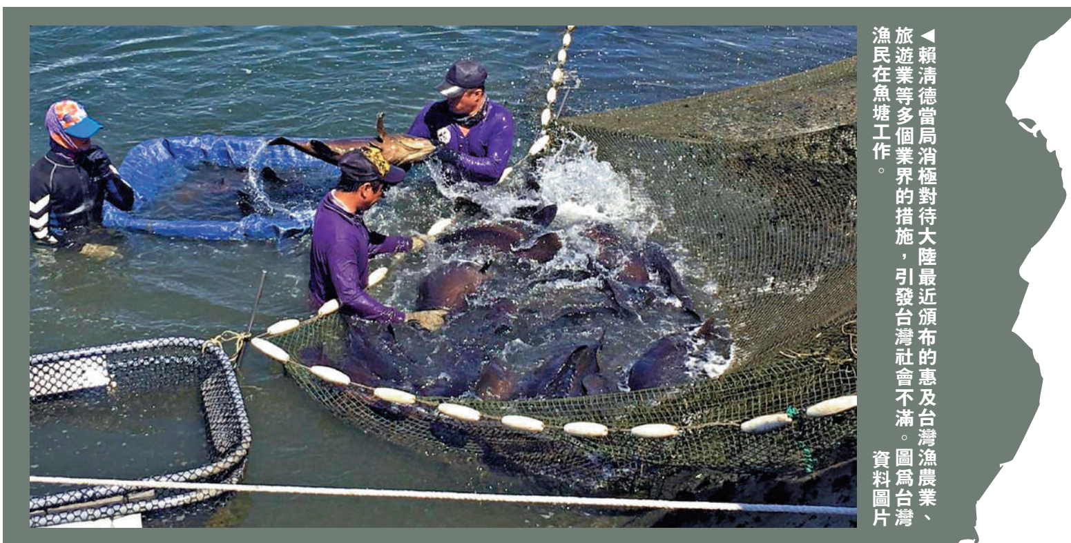
賴清德當局消極對待大陸最近頒布的惠及台灣漁農業、旅遊業等多個業界的措施，引發台灣社會不滿。圖為台灣漁民在魚塘工作。資料圖片

如今賴清德當局在兩岸、民生議題上連接被台灣社會詬病，政策後坐力相當大。從選情來看，藍營在國民黨主席鄭麗文成功訪陸之後聲勢大漲，藍白選舉合作工作也在有序進行當中。反觀民進黨縣市長參選人則需面對賴清德當局政策論述上的缺失，綠營選將們或許在正式場合中仍會與賴清德親密互動，但在軟性活動中恐怕會跟「更安全」的蔡英文「攬牢牢」。