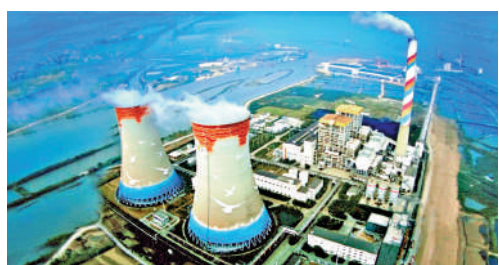
▲華潤新能源將於下周二在A股上市，為長期增長注入動力。

華潤新能源為華潤集團唯一新能源平台，主營業務為投資、開發、運營和管理風力、太陽能發電項目。華潤新能源此次集資核心是「擴規模、