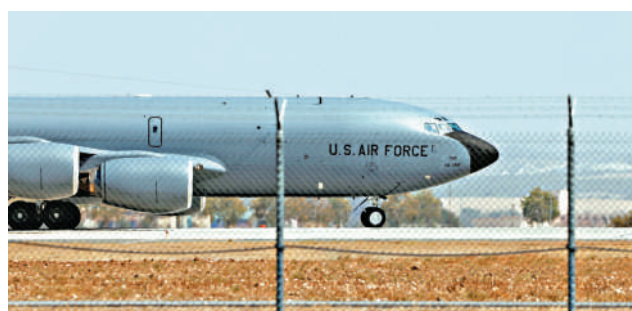
▲西班牙拒絕美軍使用該國軍事基地空襲伊朗。圖為西班牙莫龍空軍基地的一架美軍KC-135加油機。

於哪一類別。但羅馬尼亞和波蘭可能成為最大的受益者：波蘭是北約國防開支佔GDP比例最高的國家，目前已承擔駐當地1萬名美軍的幾乎所有費用。而羅馬尼亞近期擴建的科格爾尼恰空軍基地還有空間容納更多美軍，且允許美國使用這座基地空襲伊朗。