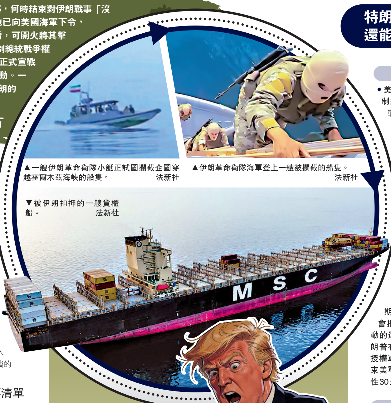
▲一艘伊朗革命衛隊小艇正試圖攔截企圖穿越霍爾木茲海峽的船隻。