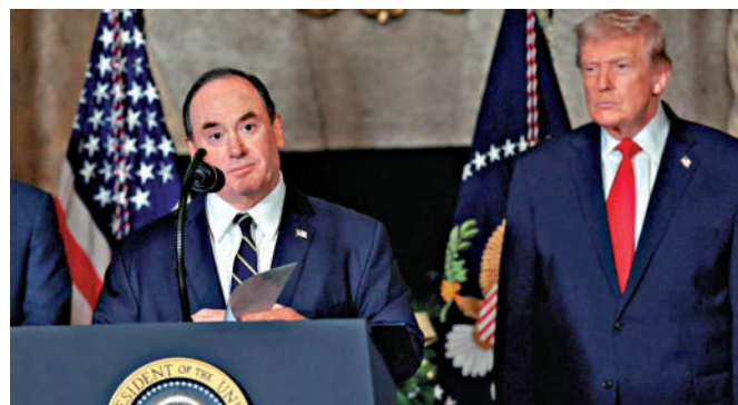
▲已被解職的美國海軍部長費倫（左）和美國總統特朗普。

五角大樓此次人事變動正值美軍在中東對伊朗港口實施大規模海上封鎖之際。美媒指出，海格塞斯上任以來已經撤換約20位高級將領及國防部官員，包括本月遭撤職的陸軍參謀長喬治，以及去年被開除的美軍參謀長聯席會議主席布朗等。