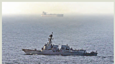
▲美軍一艘導彈驅逐艦執行對伊朗海上封鎖任務。

伊朗則連續發布消息，否認美艦通過霍爾木茲海峽。伊朗也不承認曾在霍爾木茲海峽布雷。